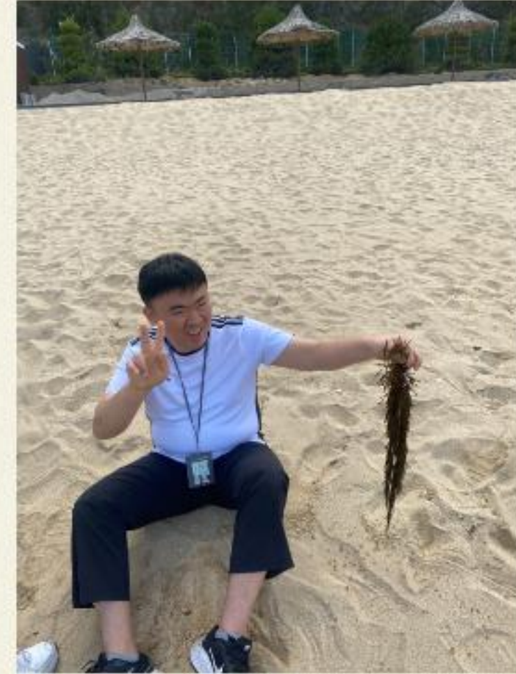
▲ 으악! 이것 좀 보세요!

정동진역에 도착하여 숙소에서 체크인 후 입주자분들과 자유시간을 이용하여 전망대와 해수욕장에 방문하였습니다.