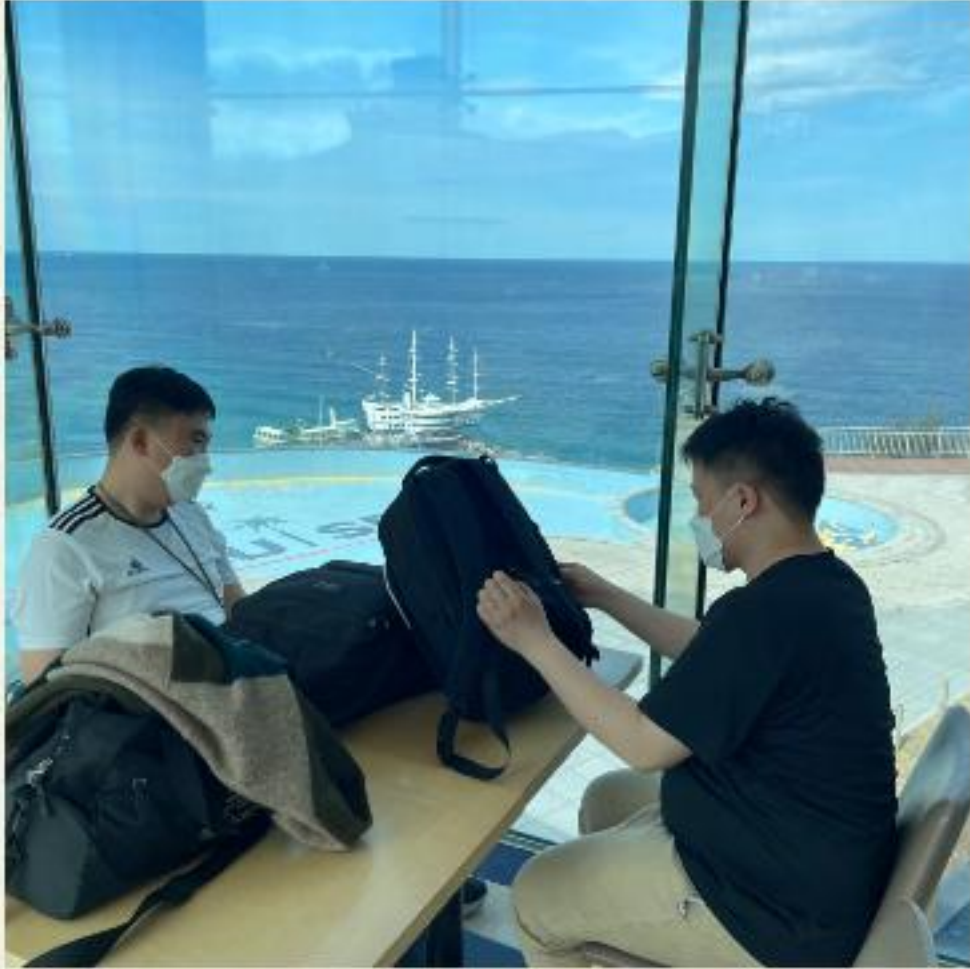
▲ 빨리 이 집을 풀고 싶네..