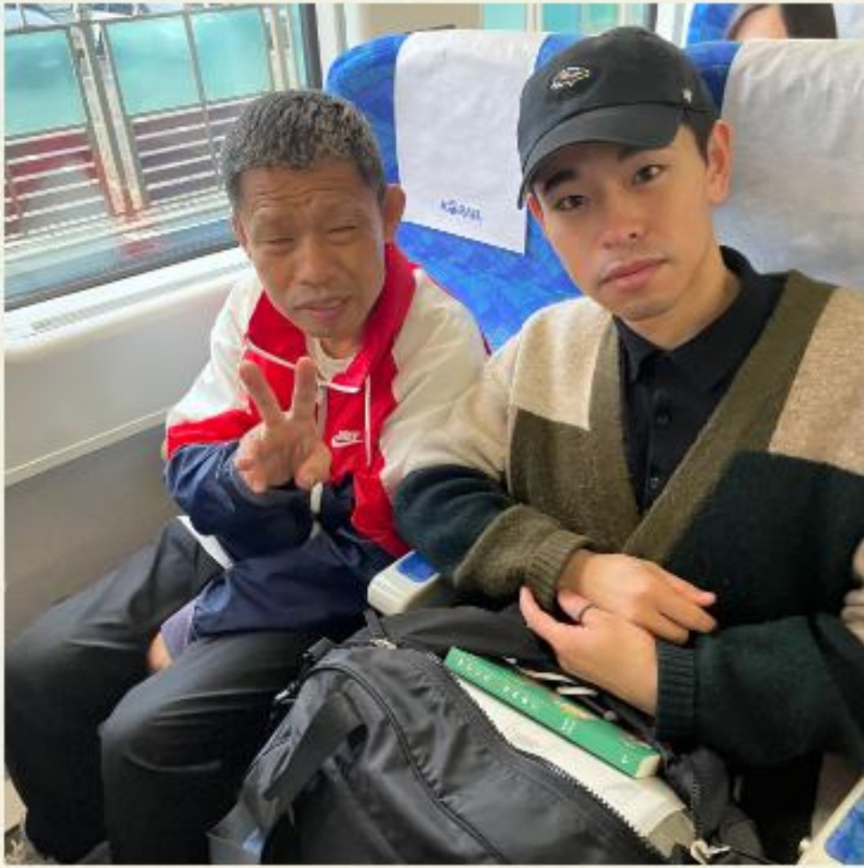
▲ 정동진으로 가는 기차입니다