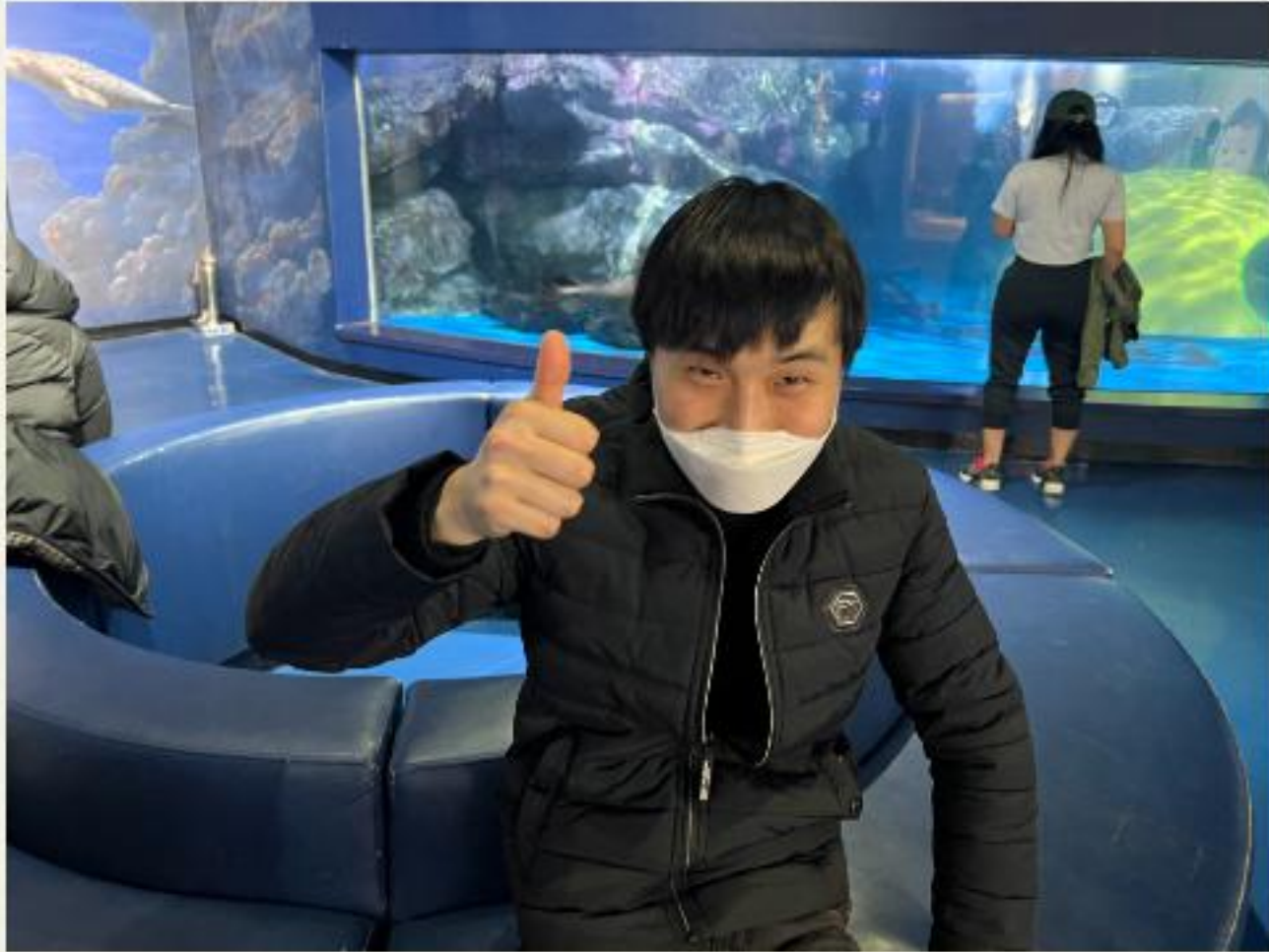
▲ 아쿠아리움에는 정말 아름다운 물고기들이 많네요 엄지 척!