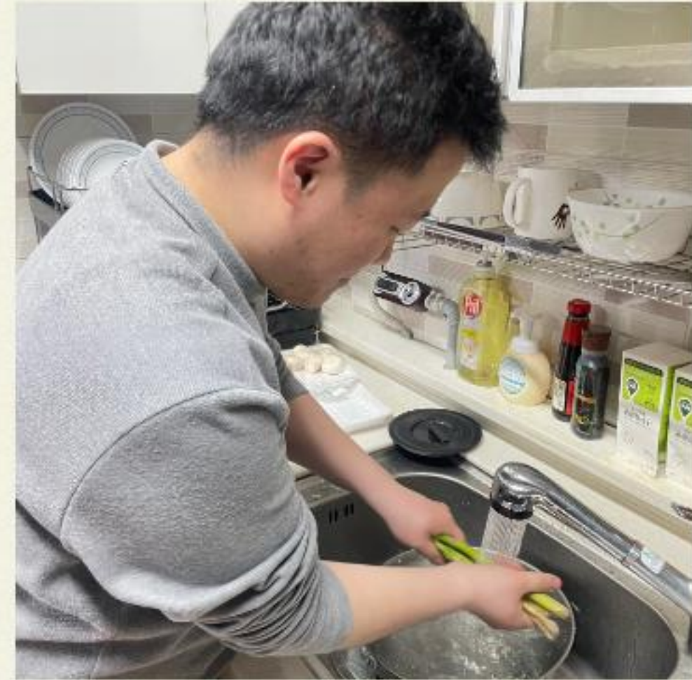
▲ 깔끔하게 손질하겠습니다.

03.22(수) 입주자분들과 다형 주택에서 큐브 스테이크 만들기 요리실습을 진행하였습니다.