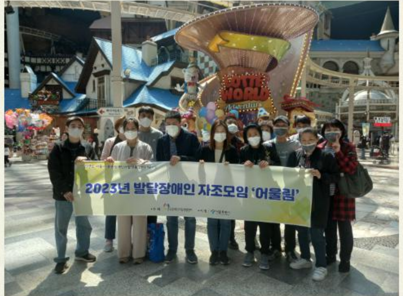
▲ 발달장애인 자조모임 '어울림' 3차 놀이공원 체험

발달장애인 자조모임 2차는 03.15(수), 아쿠아리움 관람으로 진행되었으며 참여자분들은 평소에 접하기 어려운 아쿠아리움이라는 장소에 매료되어 2차 프로그램 장소로 결정하게 되었고 아쿠아리움 관람 장소에 모여 각양각색의 해양 생물들을 관찰하고 수족관에서 진행하는 인어쇼를 관람하며 이러한 관람 활동이 많았으면 하는 바람을 내비치시며 프로그램을 종료하였습니다.