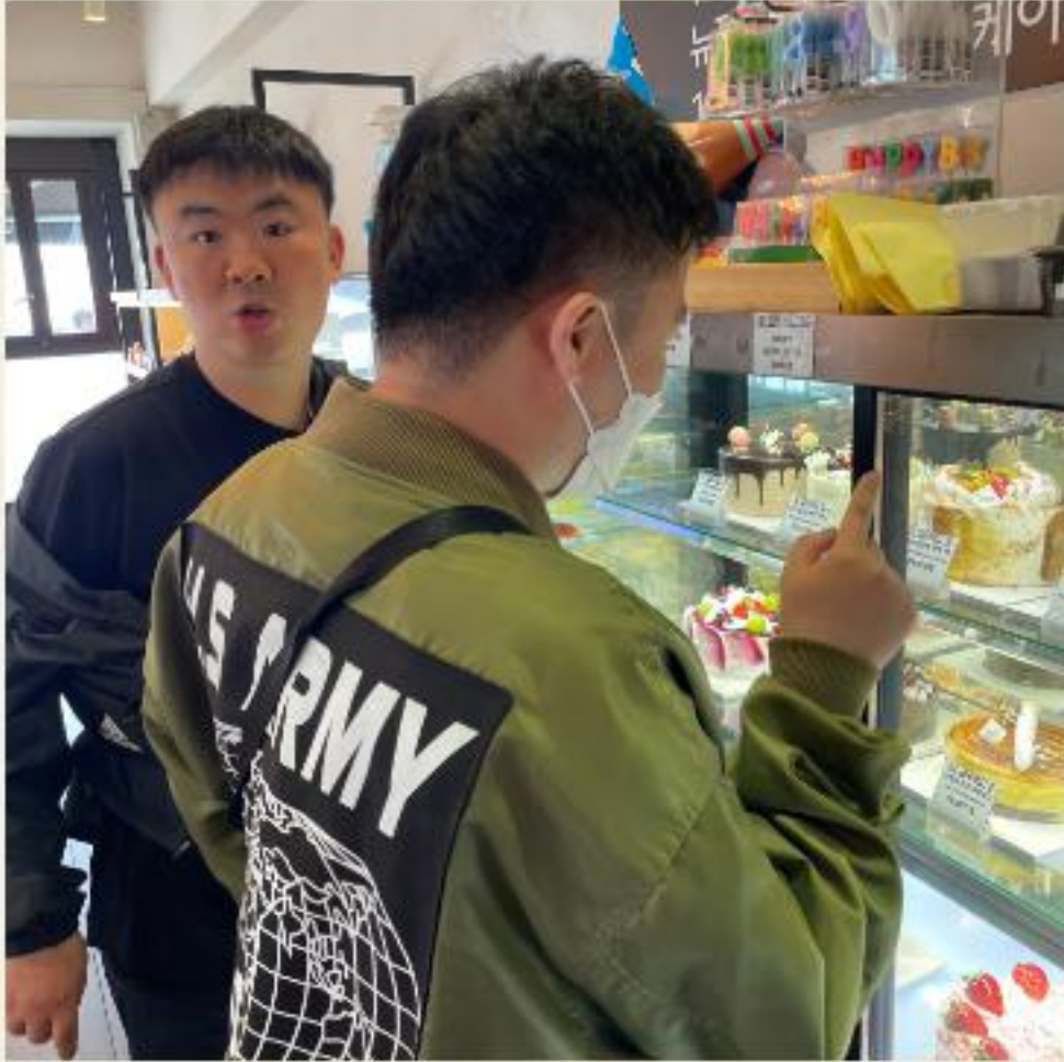
▲ 이 케이크로 하겠습니다!