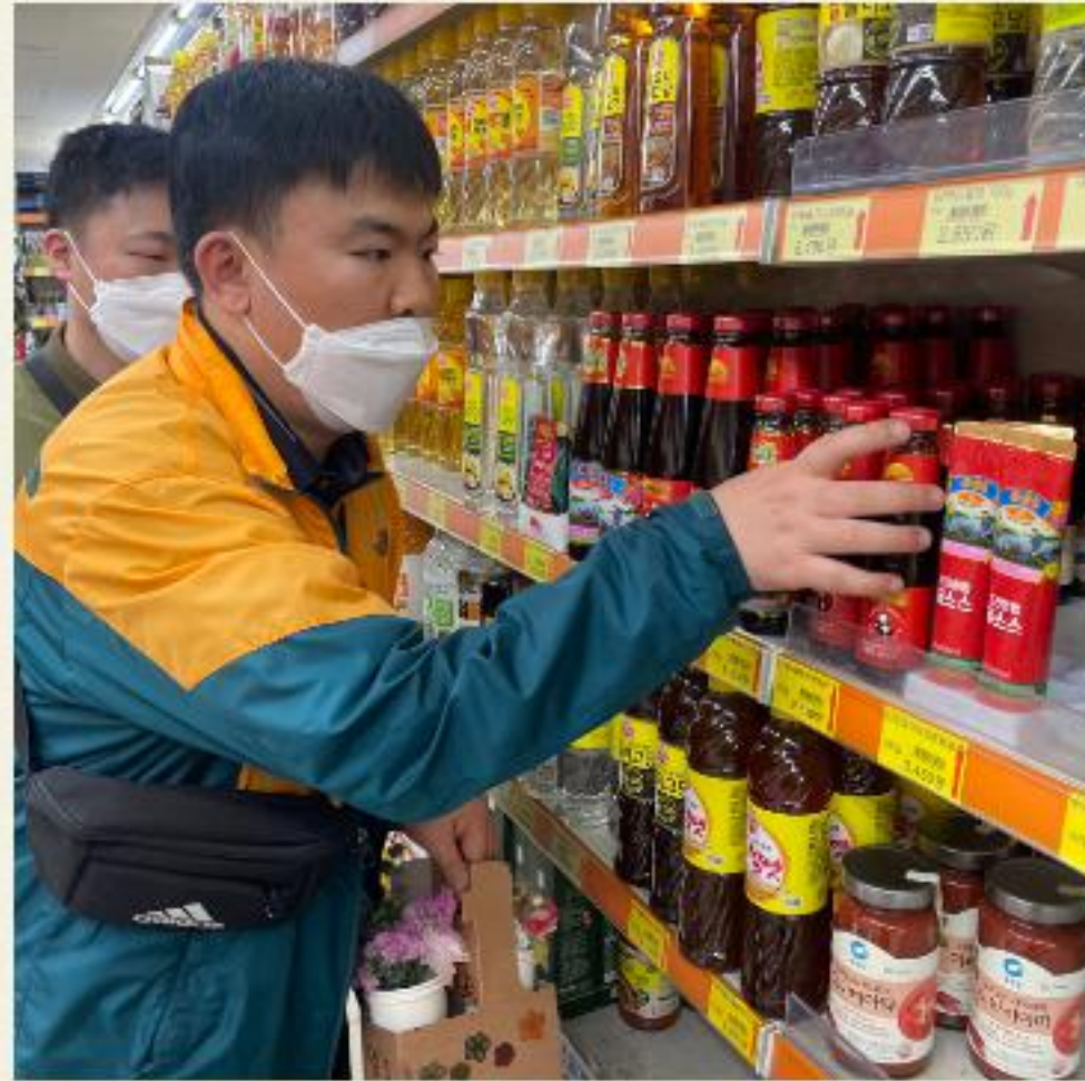
▲ 맛있는 음식에 시작한 재료입니다