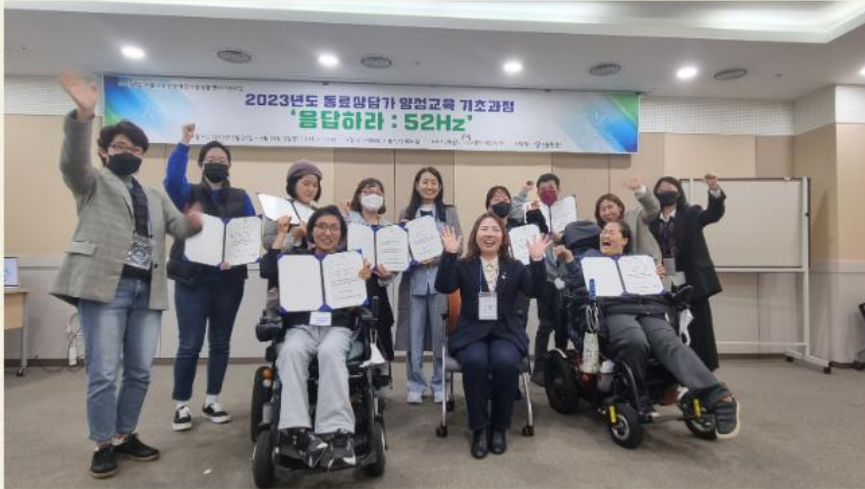
▲ 동료상담가 양성교육 기초과정 수료식 진행모습