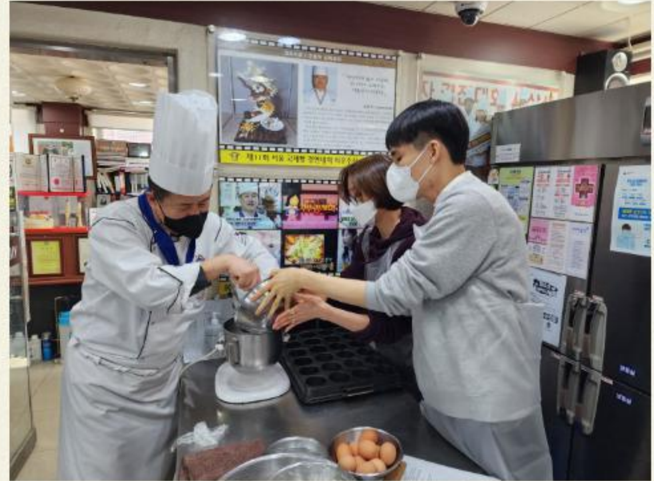
▲ 초코머핀은 이렇게 계량합니다.

2023년 발달장애인 자조모임 '어울림'이 1차 02.15(수), 2차 03.15(수), 3차 04.19(수) 총 3회 진행되었습니다.