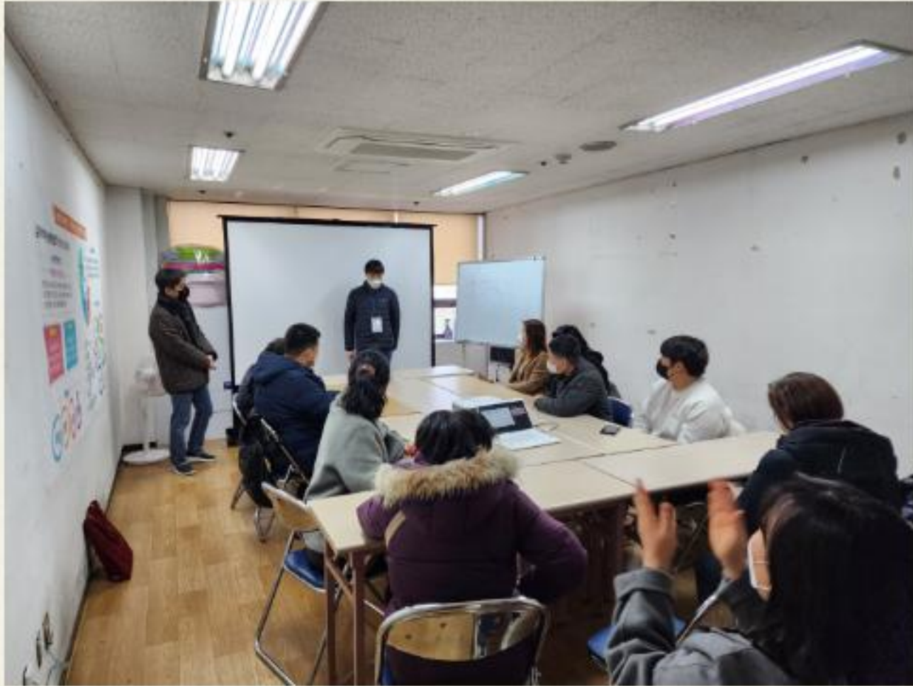
▲ 발달장애인 자조모임 '어울림' 1차 사전회의