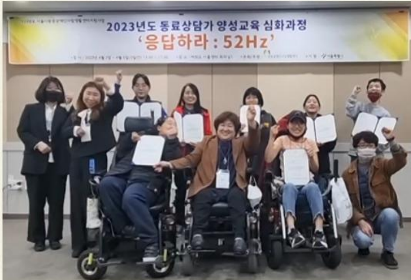
▲ 동료상담가 양성교육 심화과정 수료식 진행모습