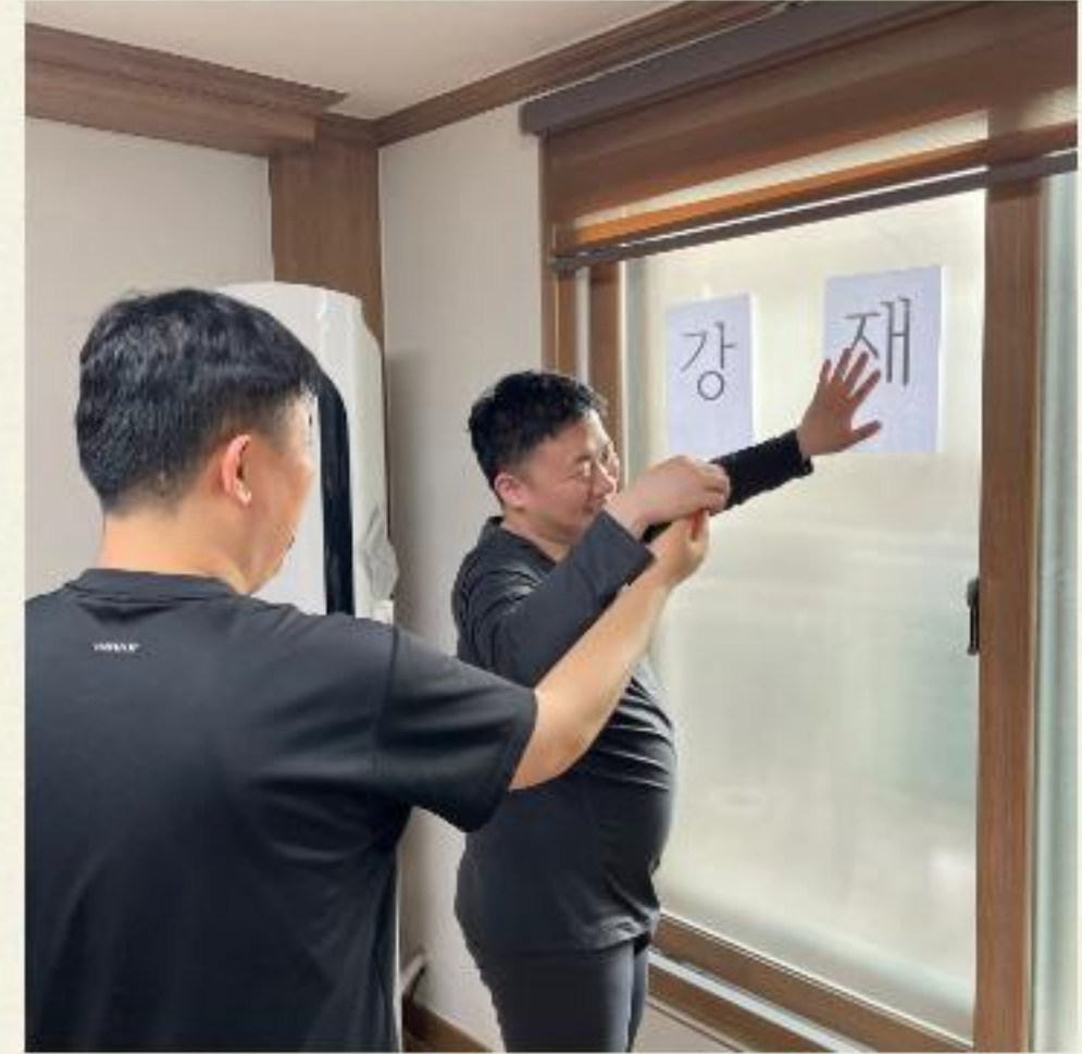
▲ 생일파티 준비는 즐거워요~

04.10(월) 다형주택 입주자 강○연씨의 생일파티 프로그램을 진행하였습니다.