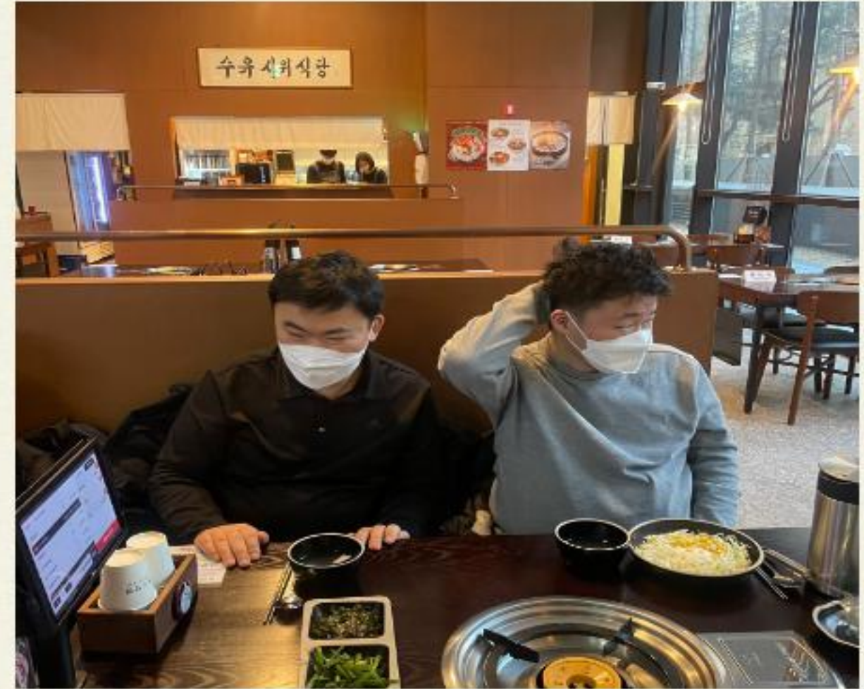
▲ 후.. 음식은 언제나오지?