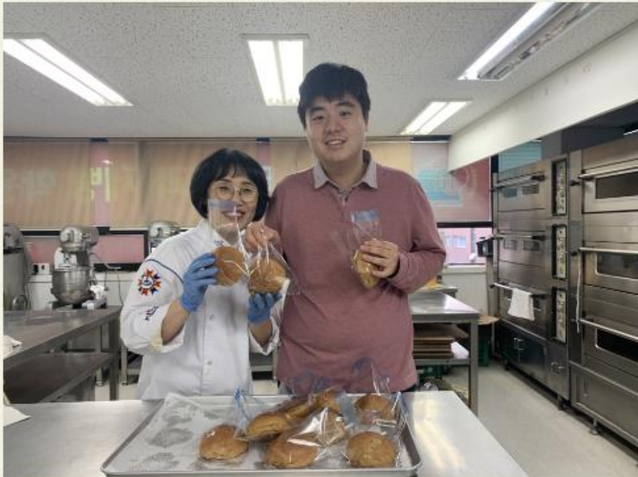
▲ 마이스터 제과제빵 원장님과 함께 찰칵!