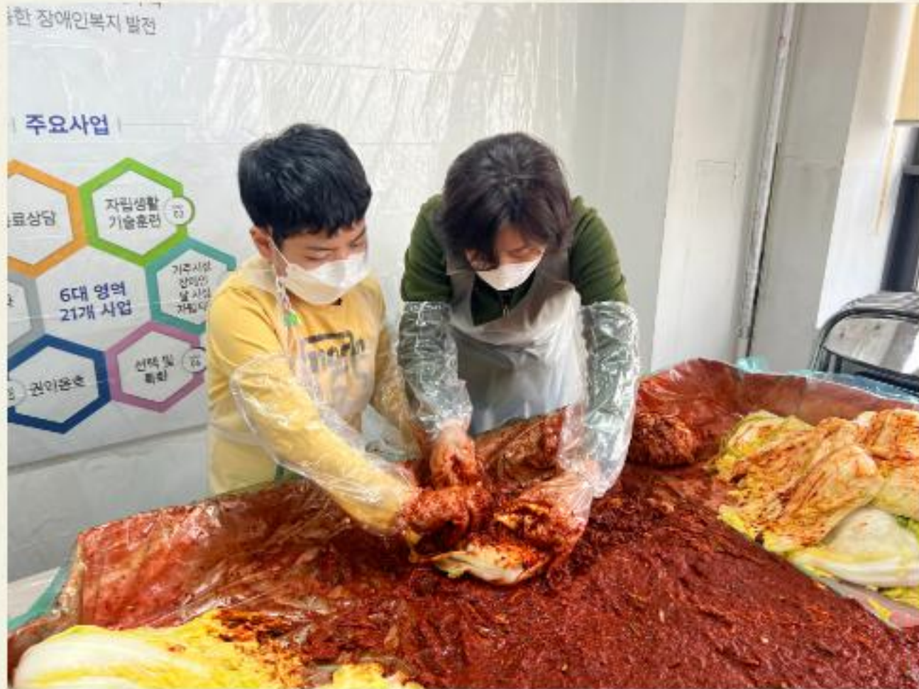
▲ 체험 김치 담그기 '나누리' 체험 진행모습