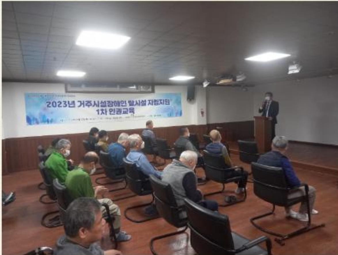
▲ 거주시설연계사업 1차 인권교육 진행모습