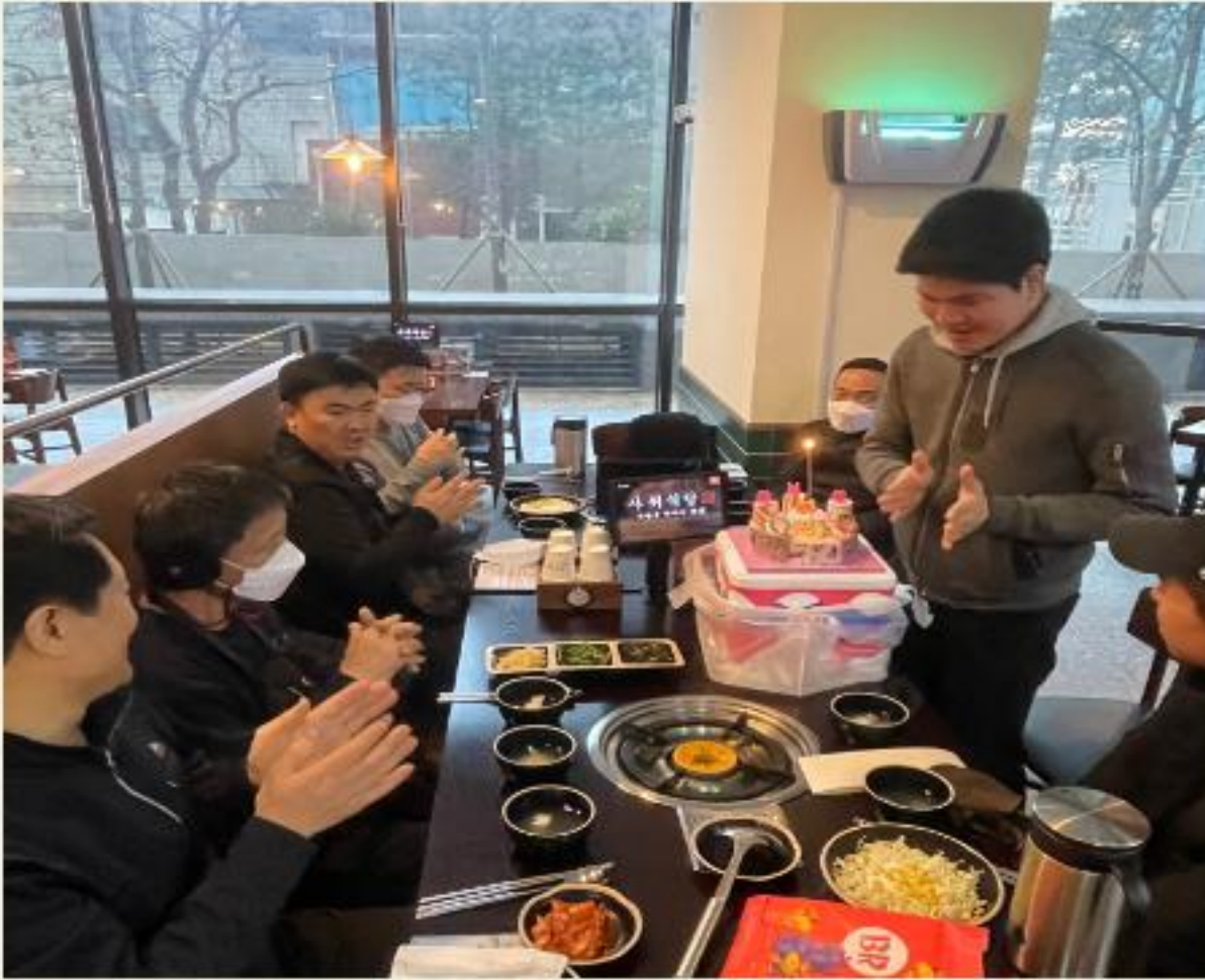
▲ 이○수님 생일축하드립니다!