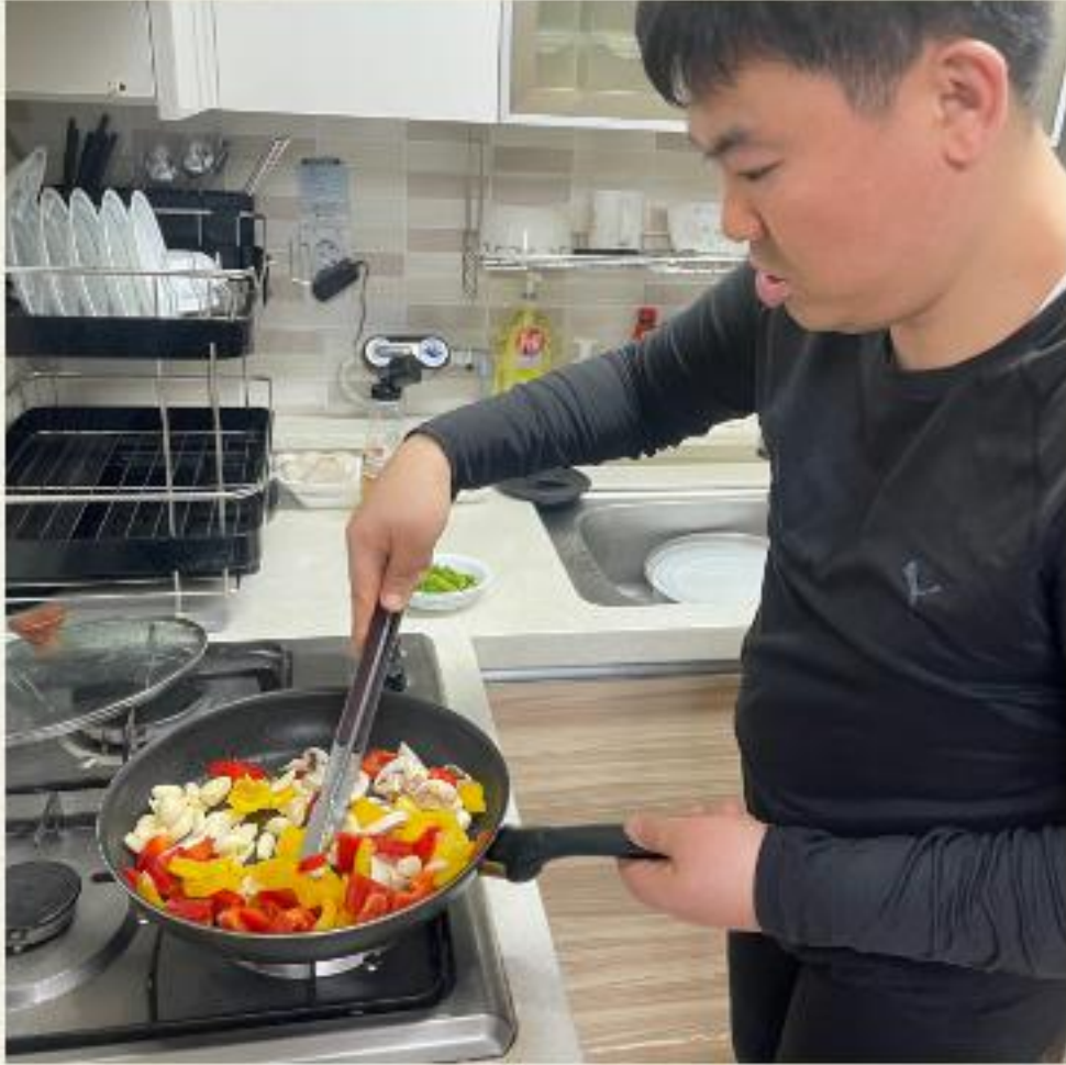
▲ 채소들을 볶아볶아서~