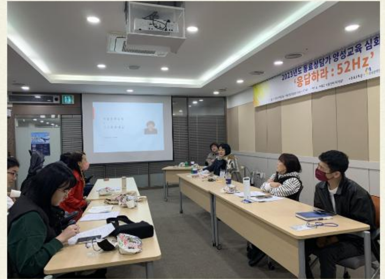
▲ 우리 모두 집중합시다!~

2023.04.03(수) ~ 04.05(금) 동료상담가 양성교육 심화과정 "응답하라 : 52Hz"가 진행되었습니다.