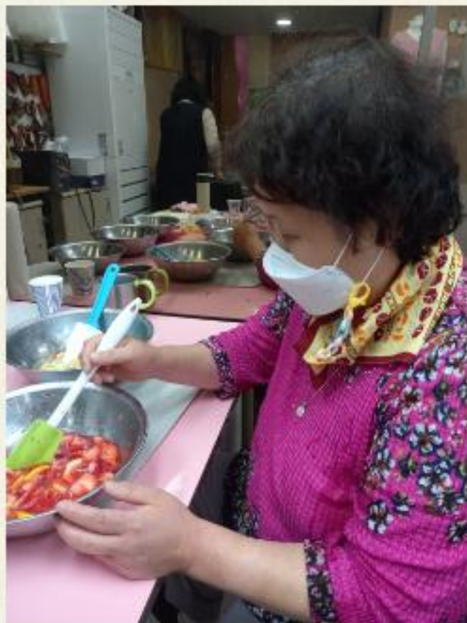
▲ 개별자립생활기술훈련 진행모습