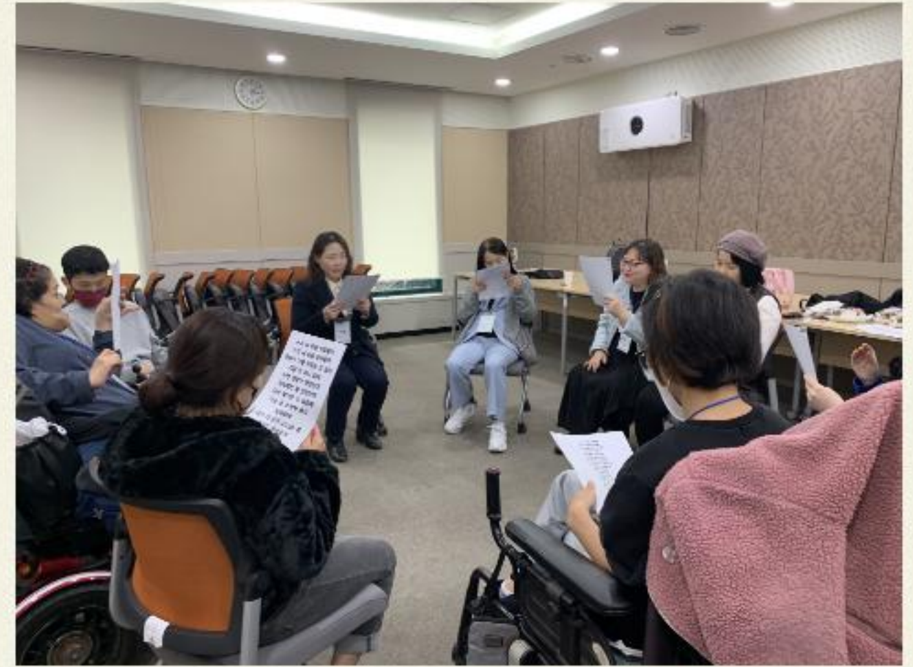
▲ 다함께 해봅시다!

2023.03.22(수) ~ 03.24(금) 동료상담가 양성교육 기초과정 "응답하라 : 52Hz"가 진행되었습니다.