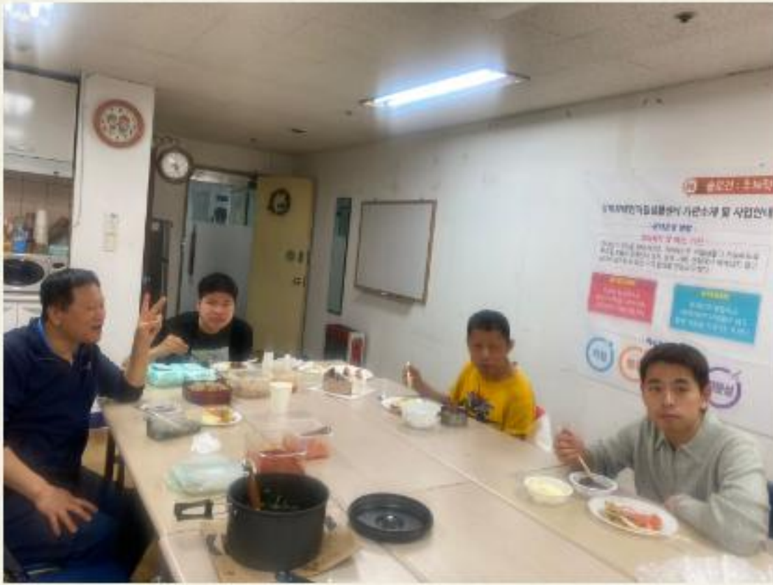
▲ 생일잔치에는 맛있는 음식이 빠질 수 없죠!