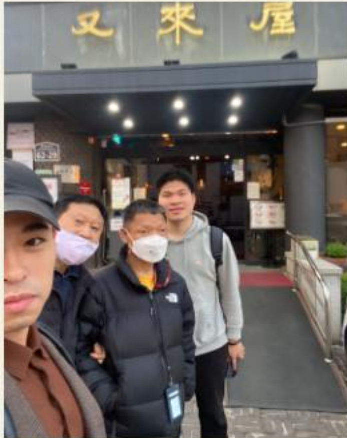
▲ 음식점 '우래옥' 앞에서