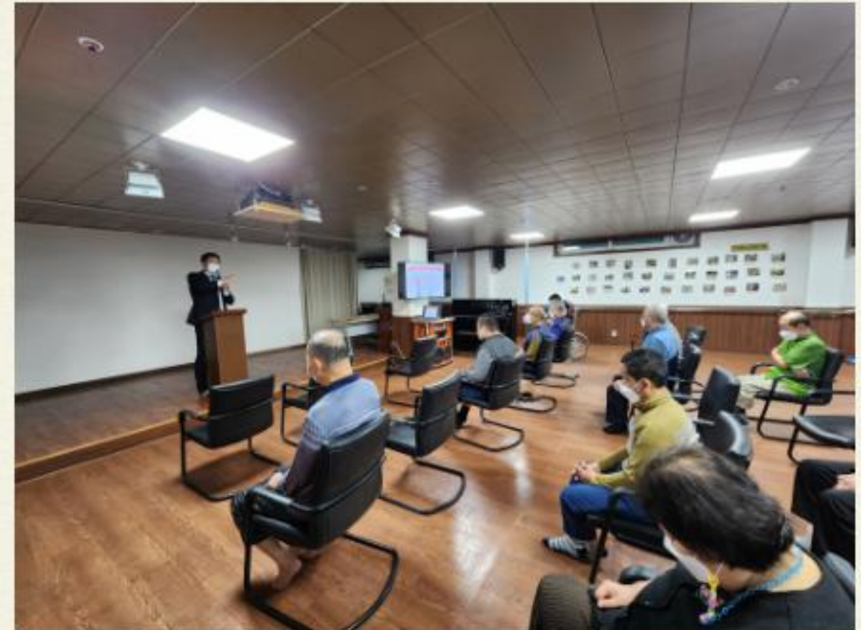
▲ 거주시설연계사업 참여자 질의응답

이번 1차 인권교육은 임동훈 인권 강사님께서 1. 인권 존중과 존엄의 가치 2. 거주인 간의 관계 개선 방안에 대해 교육을 진행하셨습니다.