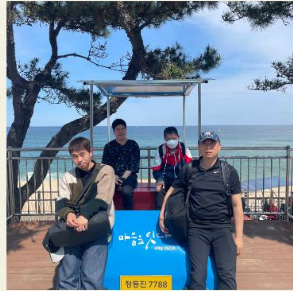
▲ 정동진에서 마음을 잇다.

04.06(목) ~ 04.07(금) 2일간, 입주자분들이 한 해 동안 기다리고 기다리던, 1박2일 문화체험, 정동진 여행을 진행하였습니다.