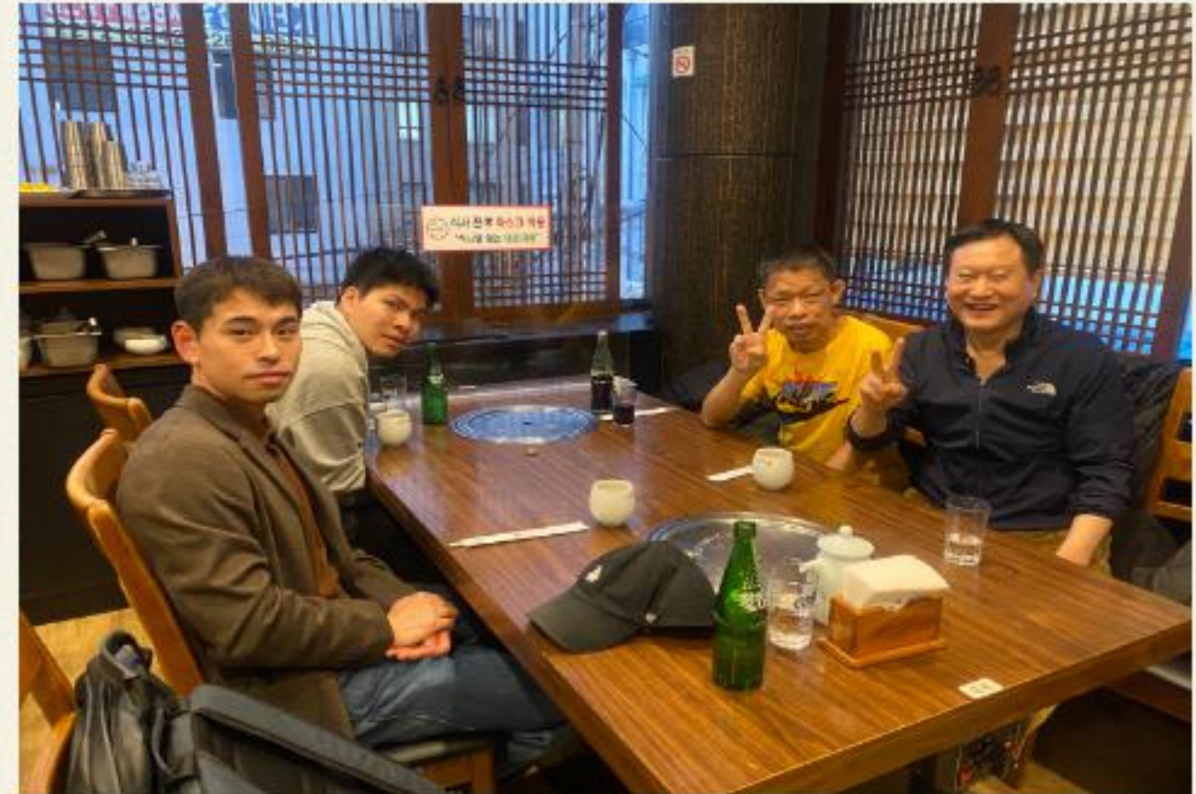
▲ 냉면이 나오기 전 단체사진

03.29(수) 가형 장애인자립생활주택 개별자립지원 프로그램으로 외식문화체험을 진행 하였습니다.