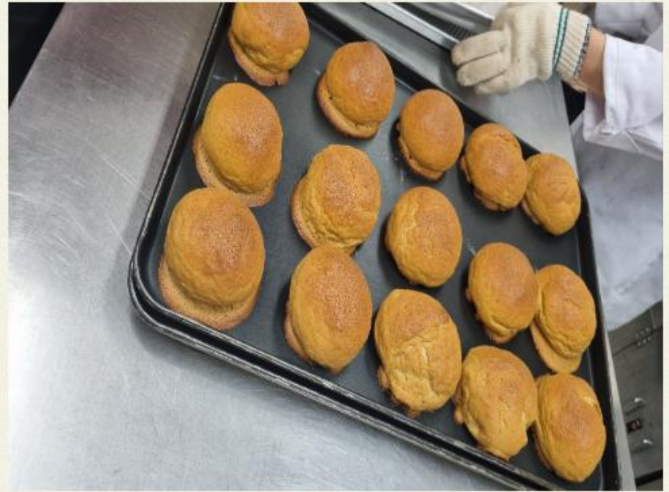
▲ 완성된 맛있는 빵입니다!

2023.03.14.(화) ~ 04.19(수) 까지 1차 ~ 10차 제과제빵 교육을 진행했습니다.