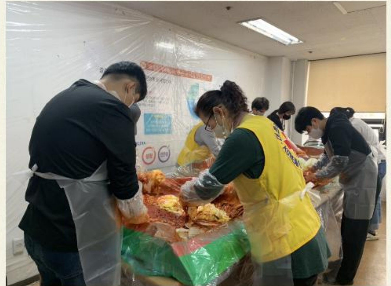
▲ 다함께 맛있는 김치를 담가봅시다.

04.21(금) 09:00 ~ 16:30 체험 김치 담그기 '나누리'가 진행되었습니다.