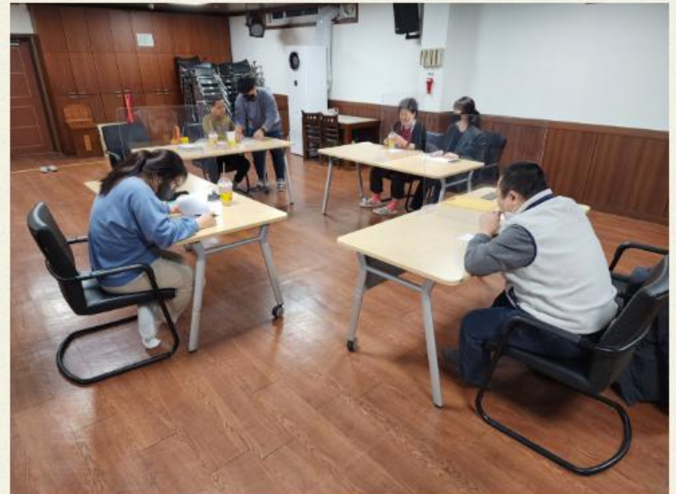
▲ 2023년에는 무엇을 하고 싶으신가요?