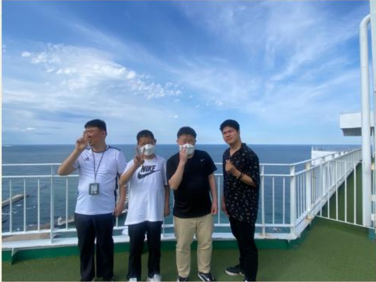
▲ 함께할 수 있으니 더욱 즐겁습니다.