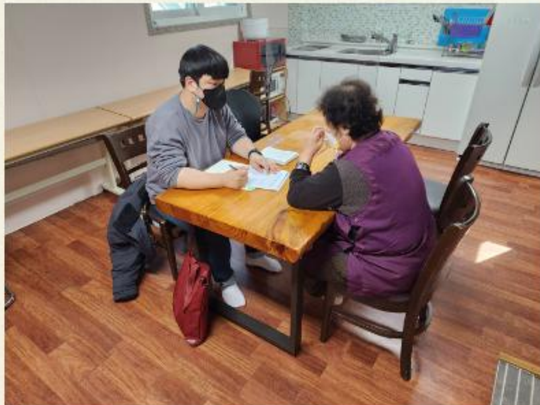
▲ 2023년 거주시설연계사업 욕구서비스 조사