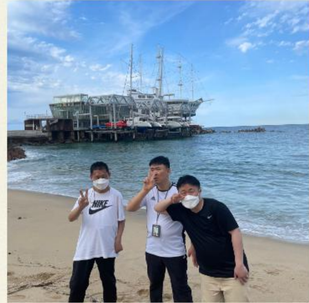
▲ 정동진 바다 앞에서 한 컷!~

04.06(수) ~ 04.07일(금) 다형주택 여가문화체험 1박2일 정동진 여행을 진행하였습니다.