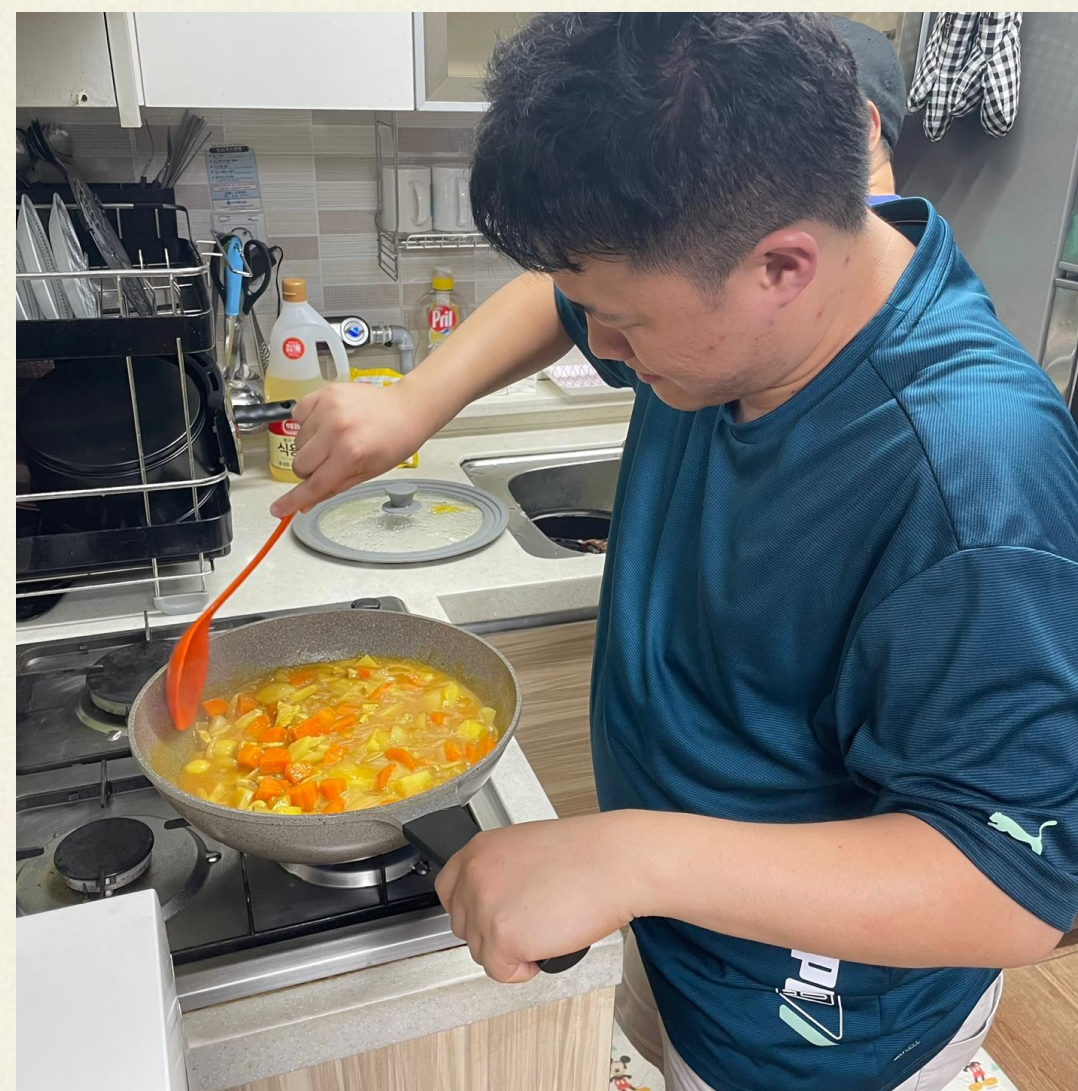
▲ 맛있는 카레 직접 만들고 있습니다!

재료손질을 위한 칼질이 다소 위험하지는 않을까 걱정을 잠시나마 하였는데, 입주자들 모두 안정적으로 칼질을 하는 모습을 통해 향후 주택 내에서 반찬을 만들 때 함께 만드는 것도 좋을 것 같다 생각하였습니다.