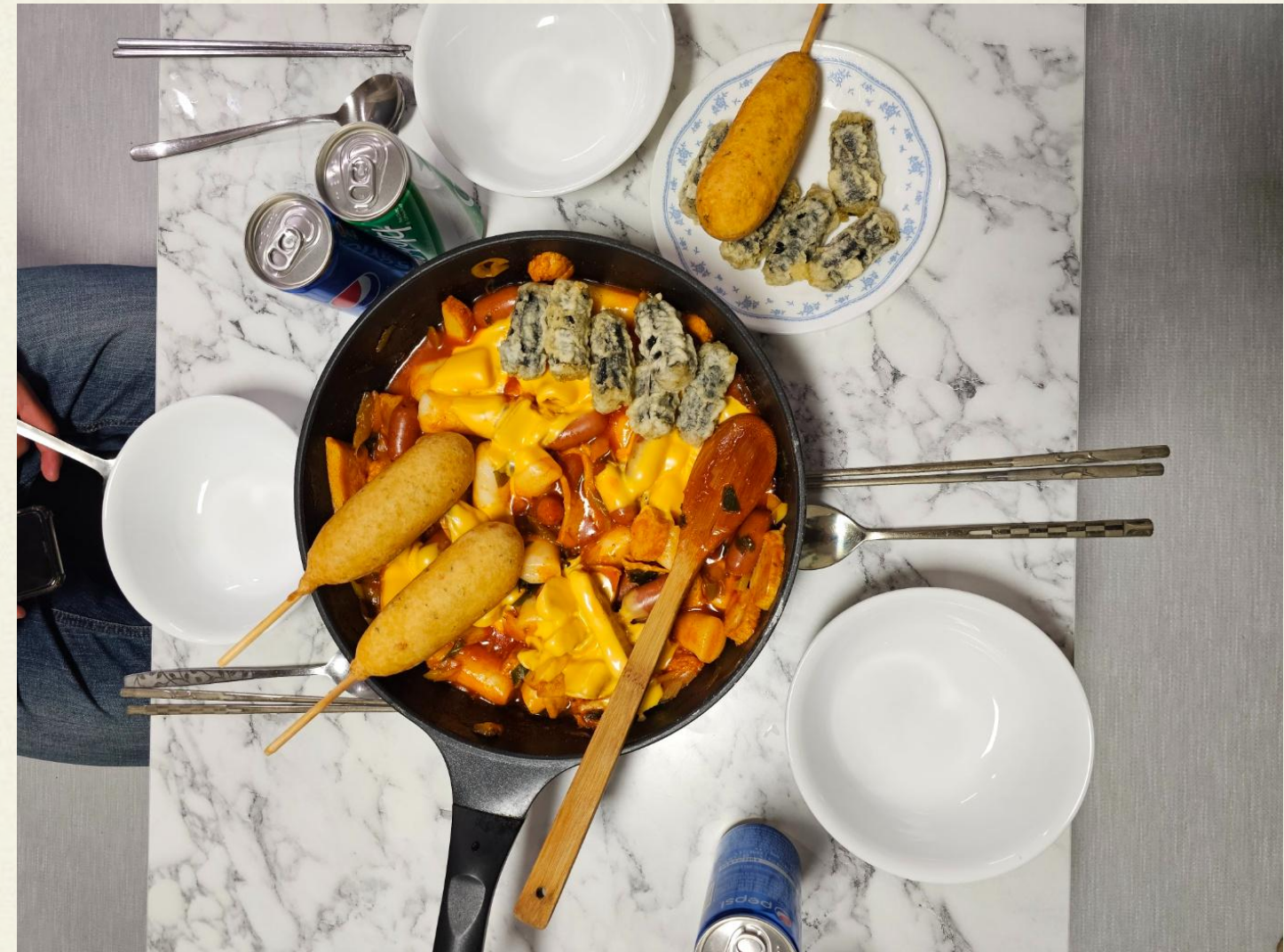
▲ 가형 주택 입주자분들이 직접 만든 떡볶이

달콤한 떡볶이를 함께 먹으면서, 인턴 근무와 일상생활에서 받았을 다소간에 스트레스를 털어버리며 각자 떡볶이의 맛있는 후기를 공 유하였습니다.