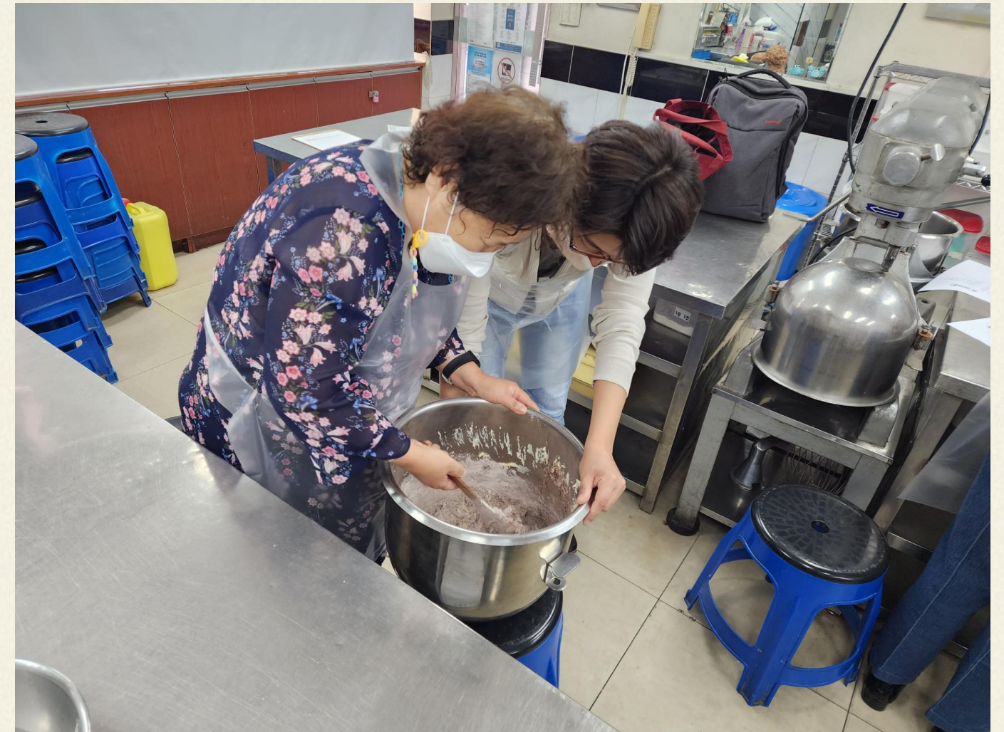
▲ 머핀 반죽, 생각보다 힘드네요?