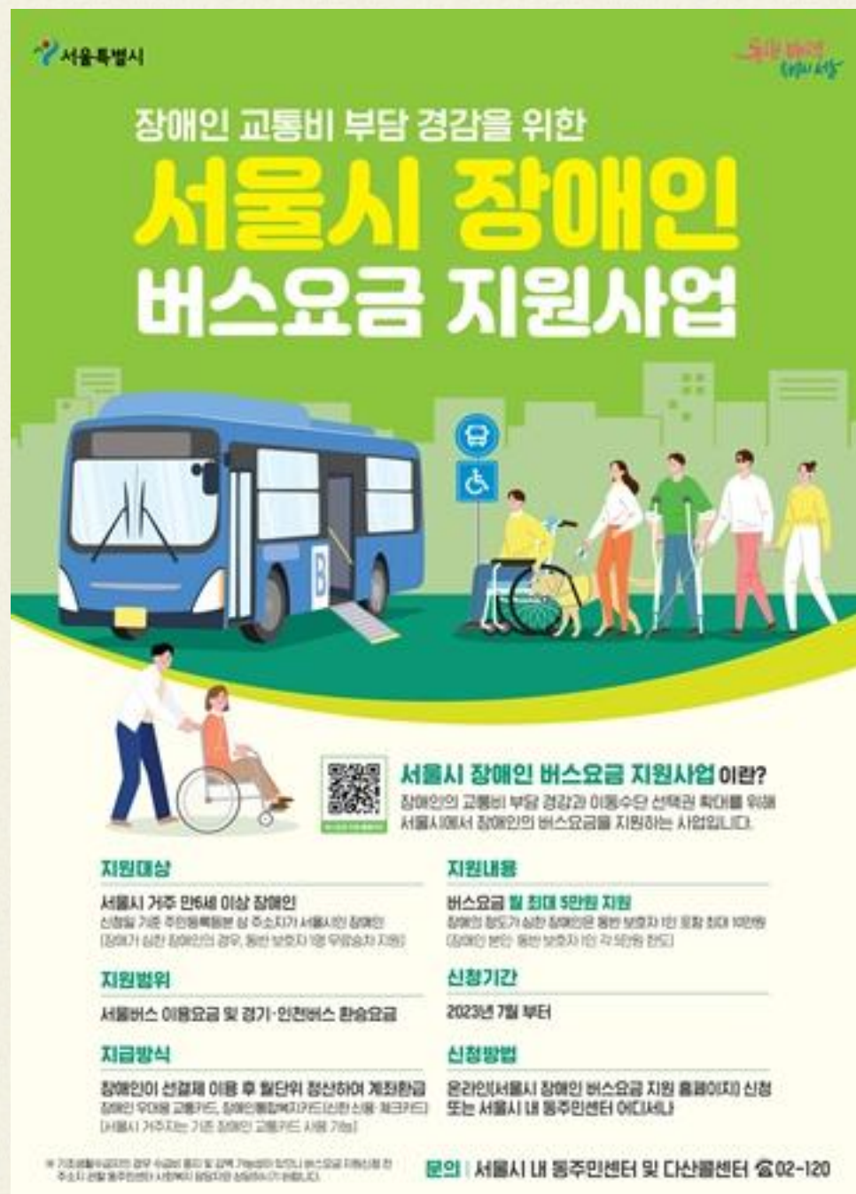
▲ 서울시 장애인 버스요금 지원 사업 포스터

지원대상은 서울시에 주민등록을 두고 있는 만6세 이상 장애인으로, 월 5만 원 한도 내에서 서울버스 및 서울버스와 연계된 수도권 (경기·인천) 버스의 환승요금을 지원한다.