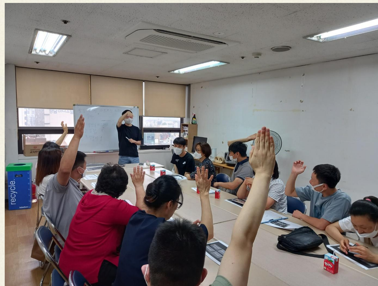
▲ 발달장애인 자조모임 5차 사전회의 진행모습

2023년 발달장애인 자조모임 '어울림'은 4차 05.24(수), 5차 06.21(수), 3차 07.19(수) 총 3회 진행되었습니다.