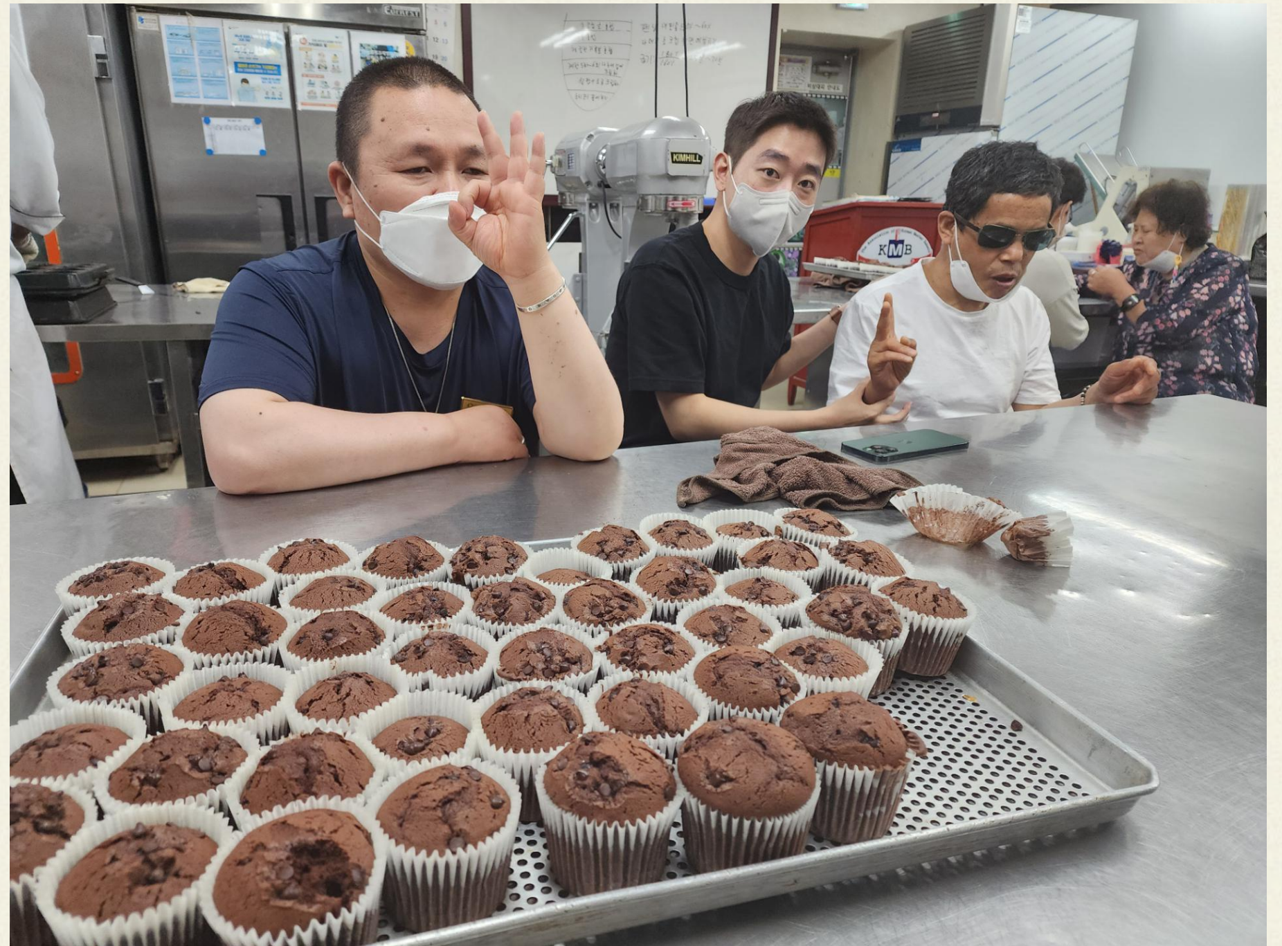
▲ 초코머핀이 식을 때 까지 기다립니다!

오븐 속에서 맛있게 구워지는 동안 참여자분들은 누구에게 몇 개 줄까... 나는 몇 개를 먹을까나... 등 행복한 고민을 하던 중 코끝에서 느껴지는 달콤한 냄새를 맡으며 입가에 미소를 지었습니다.