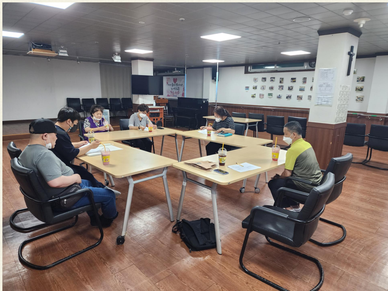
▲ 무슨 프로그램을 진행할까요?