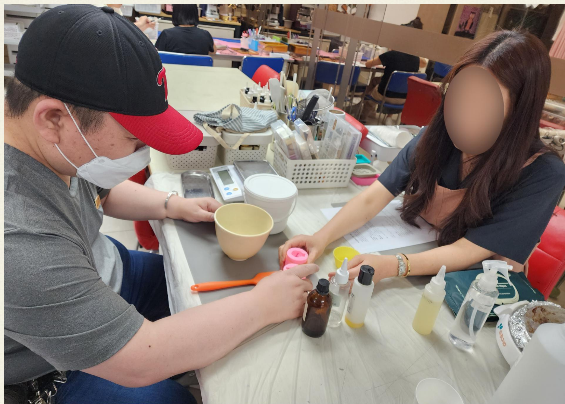
▲ 오○천님 석고방향제 만들기