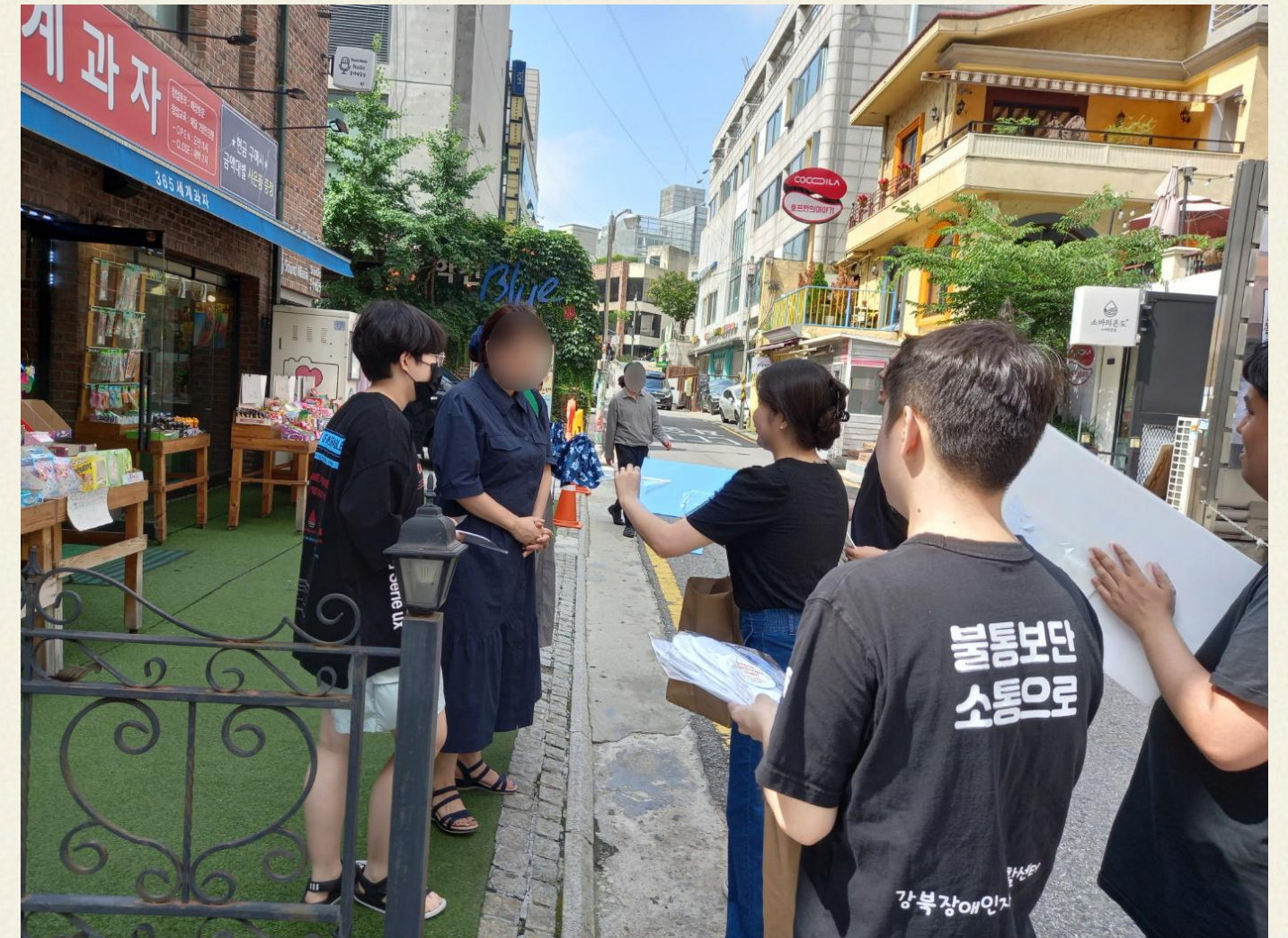
▲ 장애인에게는 무조건적 도움이 필요할까요?

07.05(수) 3차 장애인식개선 캠페인은 혜화역 일대에서 진행하였으며, 유동인구가 많은 장소임에 따라 학생부터 노년층까지 다양한 연령층을 접할 수 있었습니다. 기존에 진행했던 방식과는 다르게 장애인식개선과 관련된 표어를 스티어로 제작하여 의류에 부착 후 거리 행진을 해보니, 생각보다 많은 사람들의 시선이 느껴졌습니다.