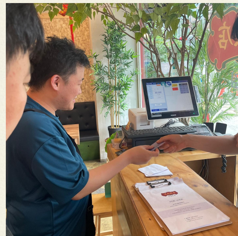
▲ 제가 먹은 음식은 제가 직접 결제합니다.

05.24(수) 다형 주택 맛집탐방 프로그램으로 미성반점에서 중화요리를 체험하였습니다.