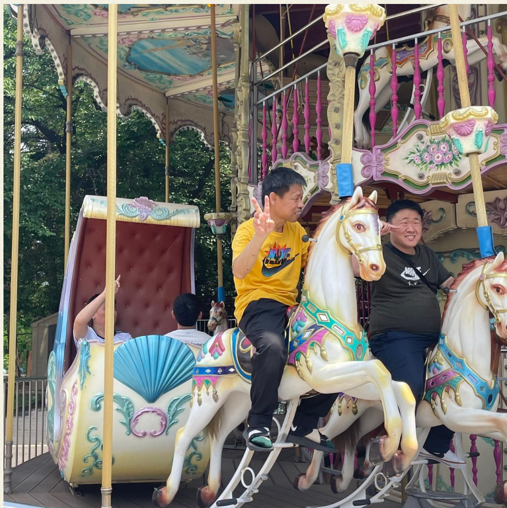
▲ 회전목마에 탑승한 입주자 신○수님