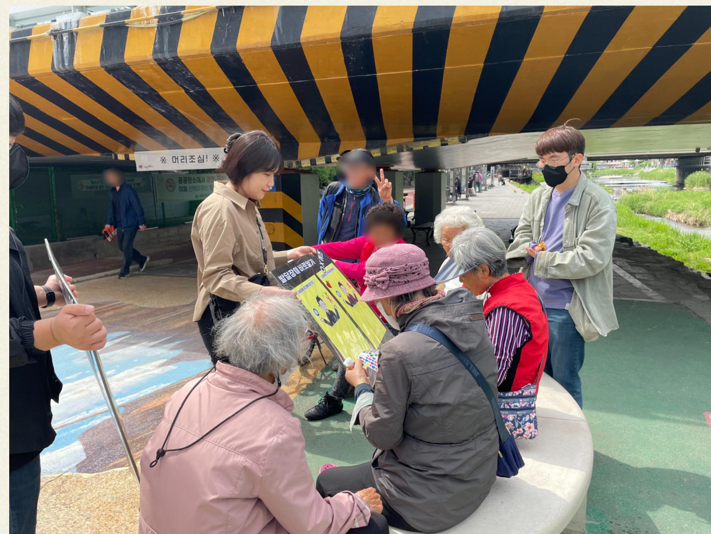
▲ OX퀴즈 어떤 것이 정답일까요?

04.24일(월) 장애인식개선 캠페인은 활동가분들과 사전회의를 통해 전반적인 진행 방향에 대하여 의논하였습니다. 벚꽃이 만개하는 4월 초 우이천 일대에서 진행하고자 하였으나, 미세먼지와 우천으로 인하여 대략 3주 정도가 미뤄졌답니다. 비록 벚꽃은 다 떨어진 우이천이었지만, 준비한 '발달장애 바로알기' 캠페인을 진행하였으며, 내용은 '발달장애인을 아시나요?', '발달장애인을 이렇게 대해주세요', '발달장애 바로알기 OX퀴즈' 등으로 구성되었습니다. 지역주민분들의 참여를 독려하고자 직접 쉬고 계신 정자에 찾아가기도 했습니다.