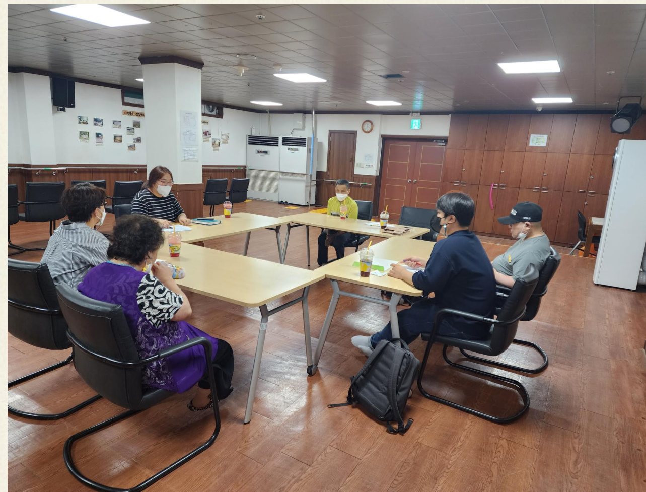
▲ 이렇게 하는 건 어떠신가요?