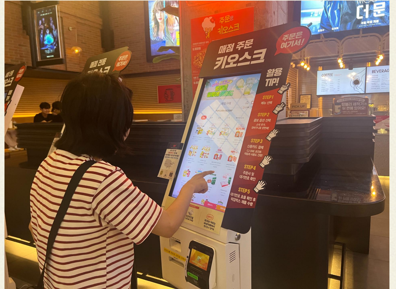
▲ 즐거운 영화와 함께 즐길 간식을 고르고 있습니다.

발달장애인 자조모임 5차는 06.21(수), 남산타워 투어를 주제로 진행하였습니다. 남산타워 투어는 서울N타워에서 진행하였으며 프로그램 진행 당일 약간에 비가 내리고 흐린 날씨가 지속되어 서울시내를 관람하기 어려울 것이라고 판단 되었는데 예상 외로 타워에 오르자 서울시내 절경이 다 보였고 오히려 흐린날씨 덕분에 참여자분들을 제외한 관람자가 적어 쾌적한 관람을 할 수 있었습니다.