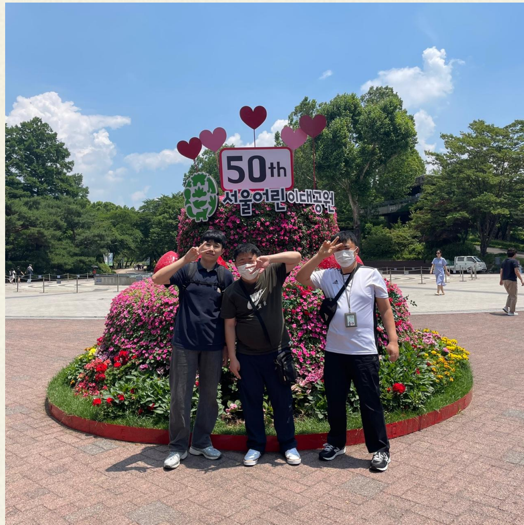
▲다형 장애인자립생활주택 단체사진