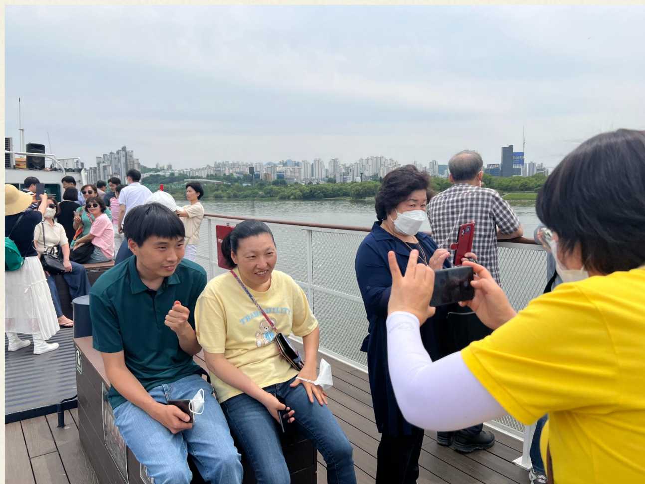
▲ 유람선 위에서 한강을 배경으로 찰칵!