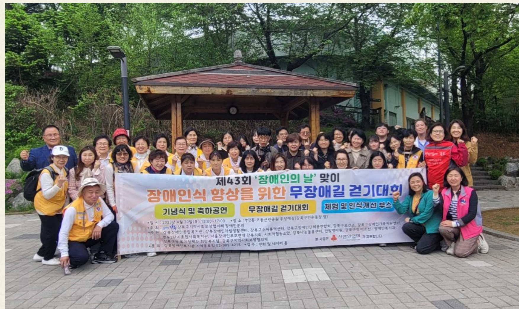
▲ 장애인식개선을 위해서 화이팅!!

이번 행사는 강북구민의 마음의 턱을 낮추고 장애인식 향상을 위한 무장애길 걷기대회 활동으로 장애·비장애 통합환경을 조성하는데 기여하고자 하는 목적으로 올해는 오동근린공원에서 진행되었습니다,