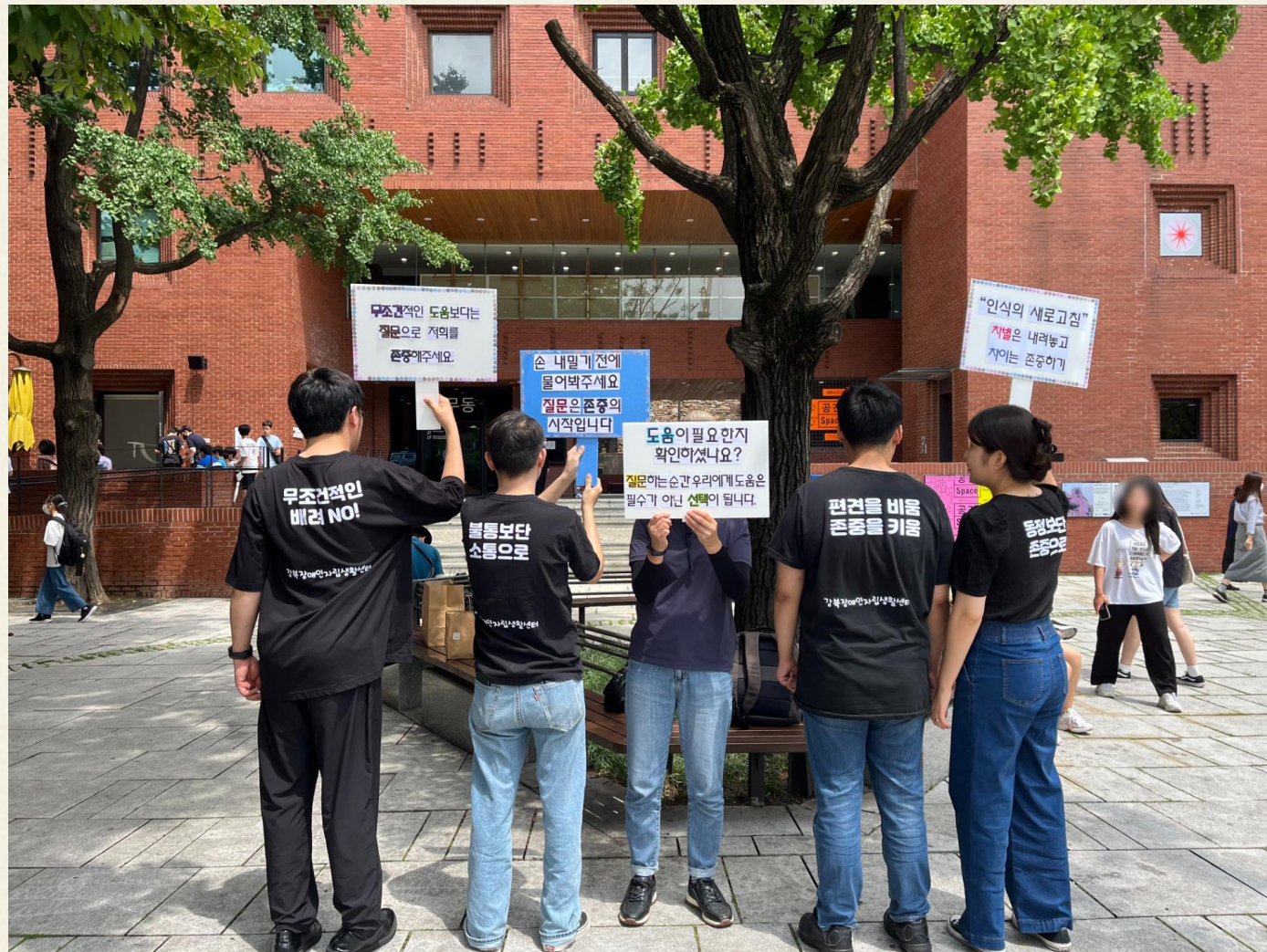
▲ 3차 장애인식개선캠페인 단체사진