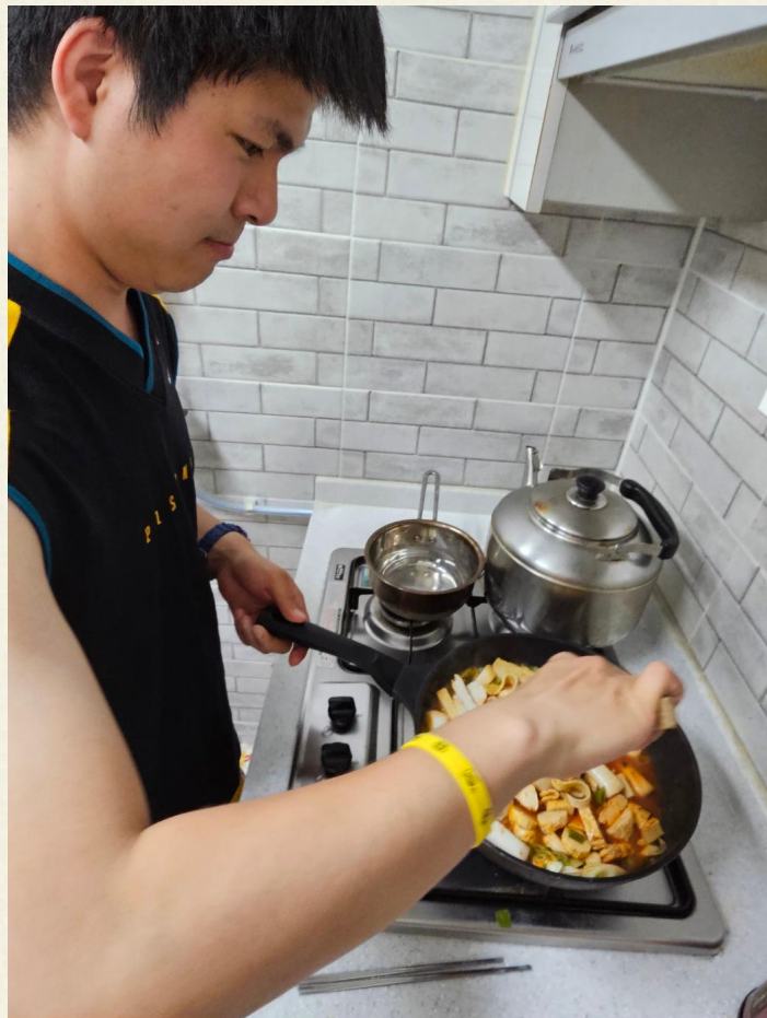
▲ 떡볶이를 볶는 모습