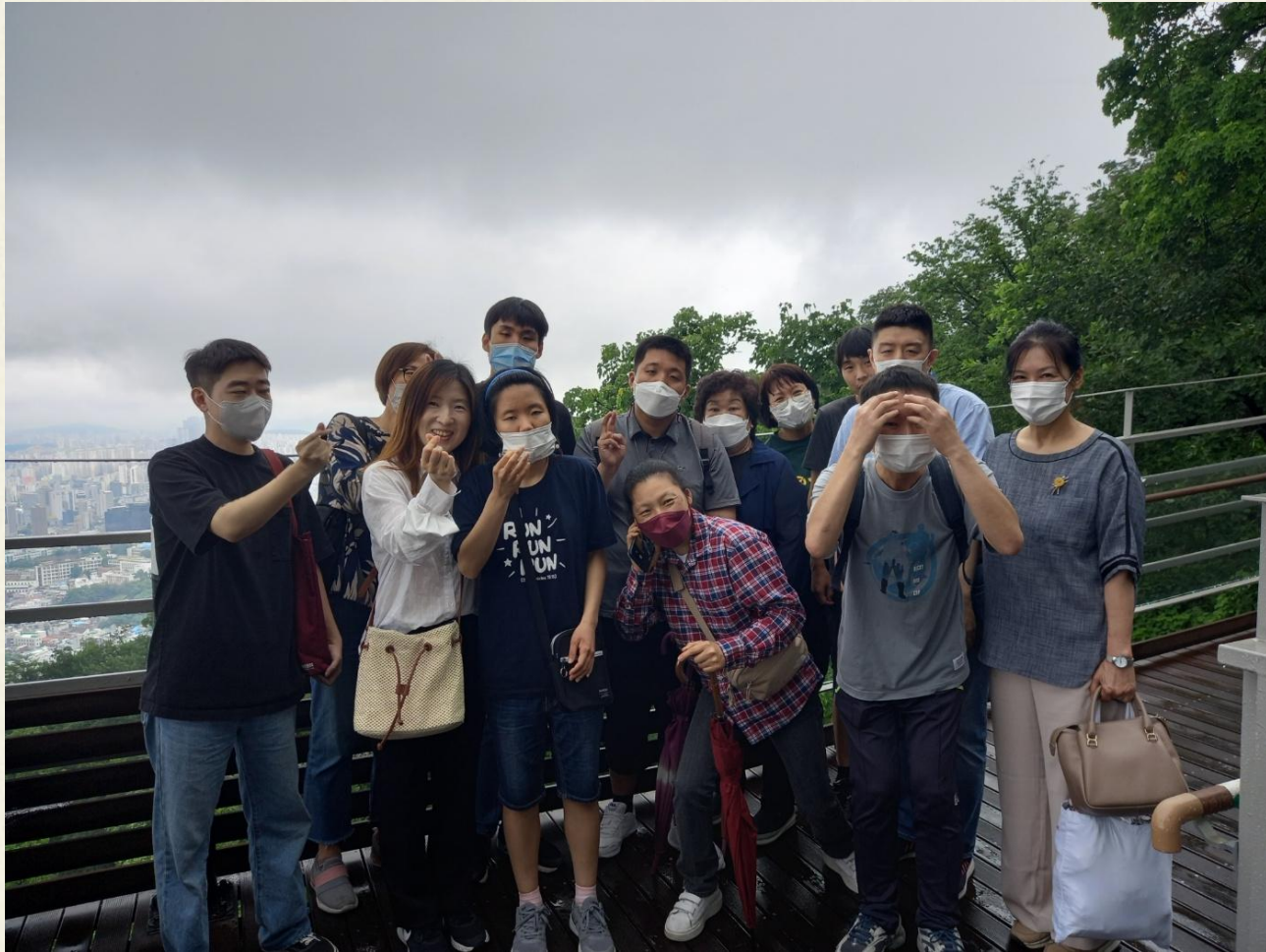
▲ 발달장애인 자조모임 5차 남산타워 투어 단체사진