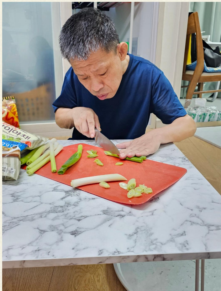
▲ 재료를 손질하는 모습