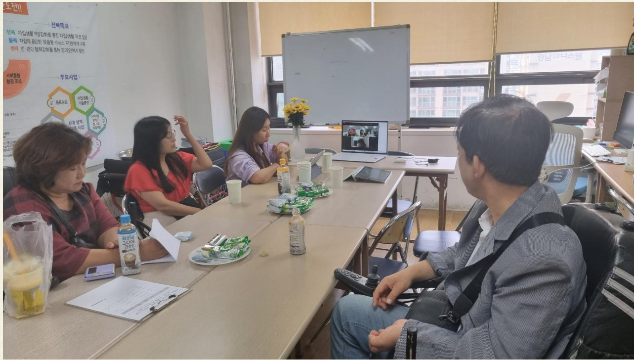
▲ 동료상담 사례회의 진행 모습