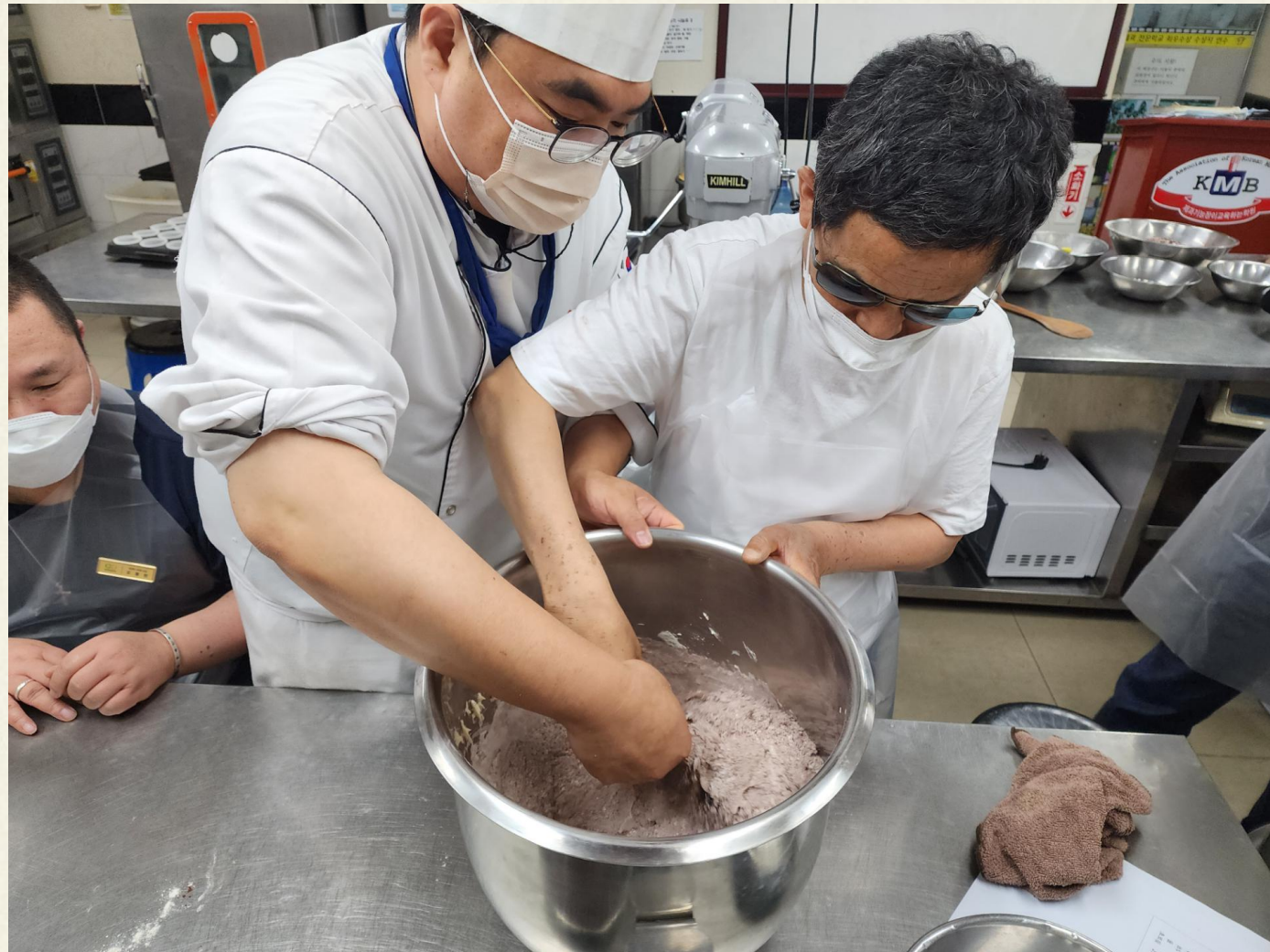
▲ 이렇게 반죽하시면 됩니다