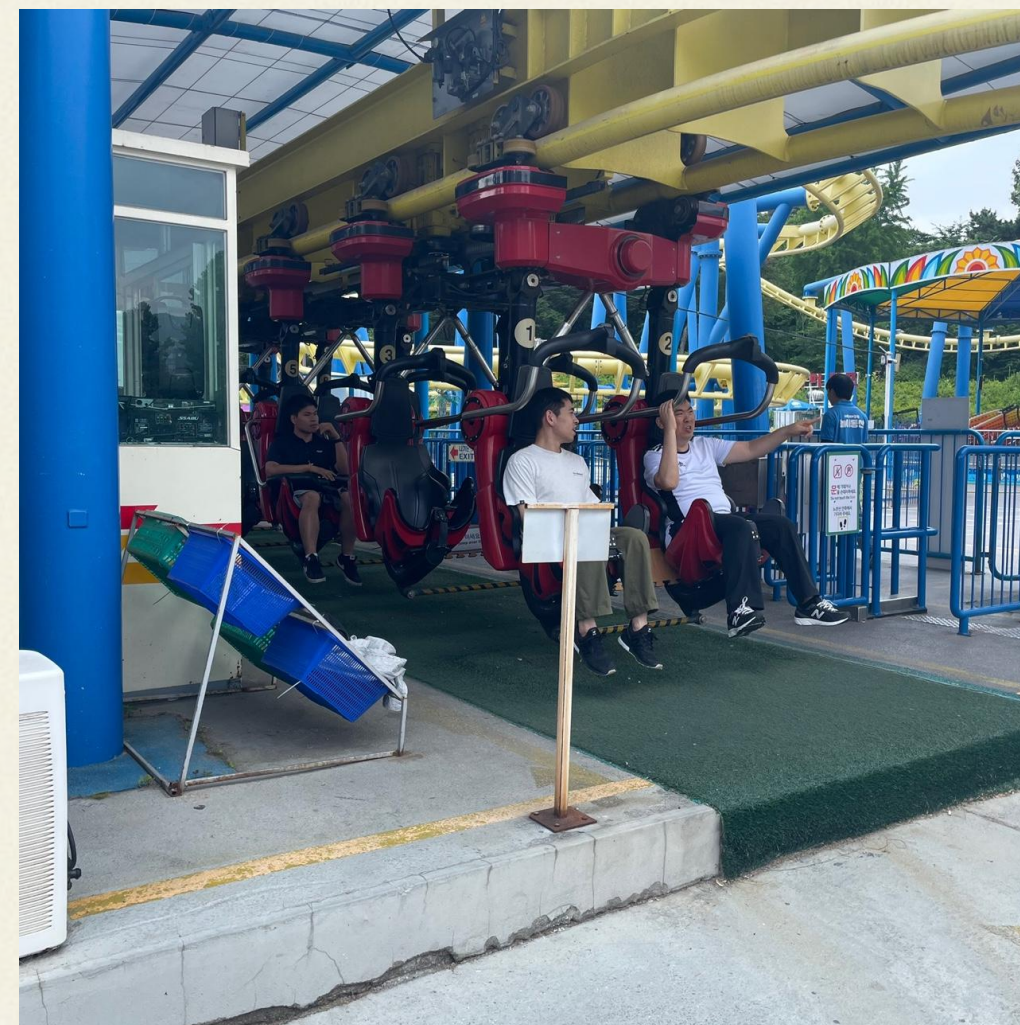
▲ 놀이기구에 탑승하여 출발을 기다리는 모습