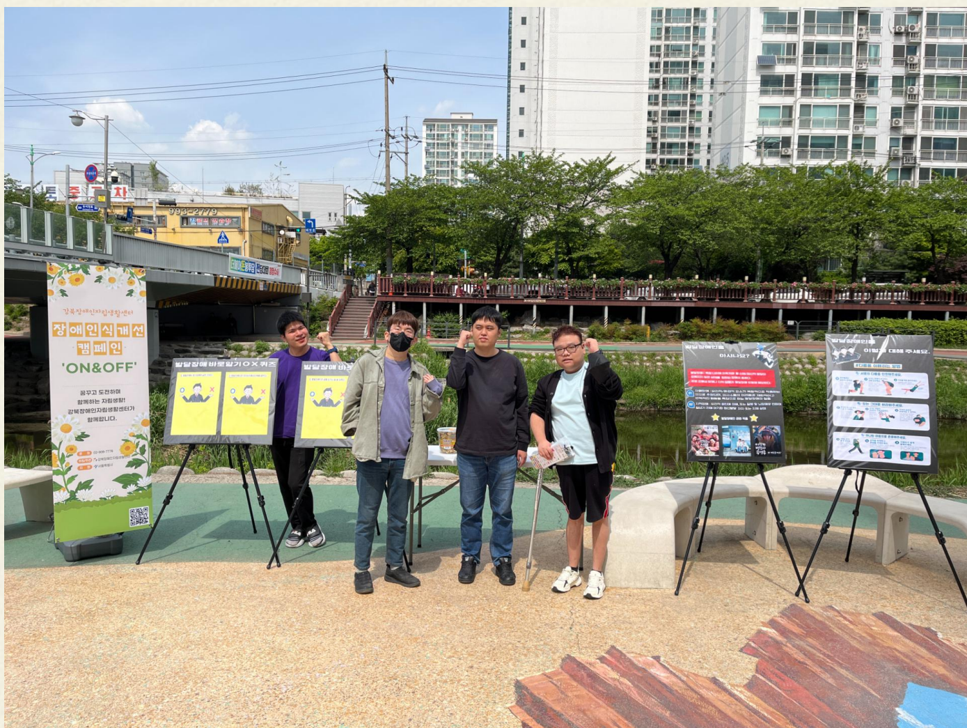
▲ 장애인식개선캠페인 활동가 단체사진