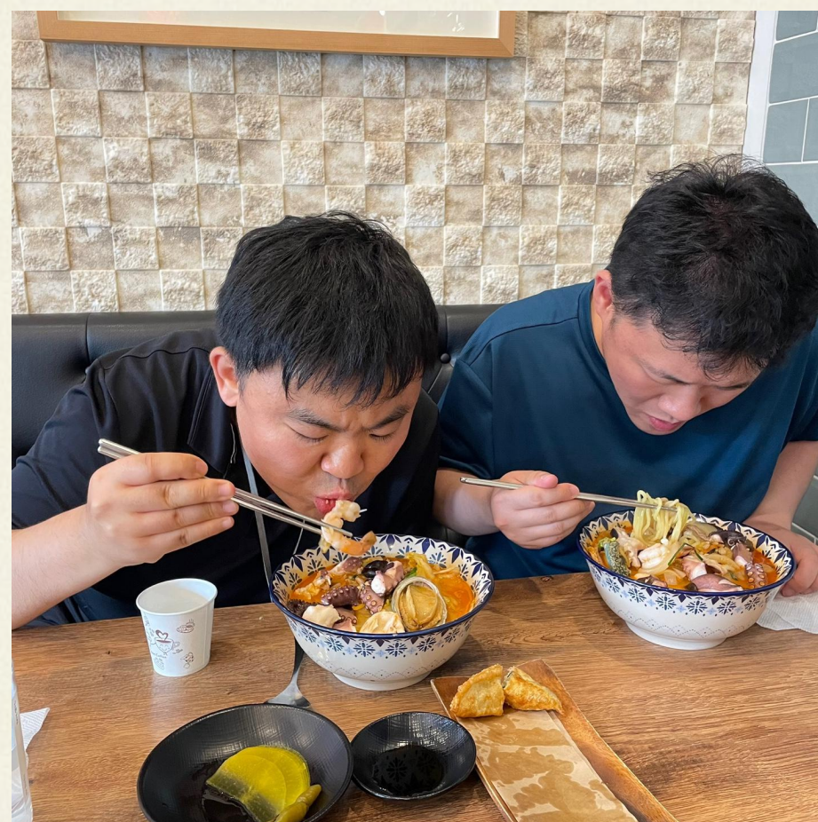
▲ 중화요리 체험 진행 모습