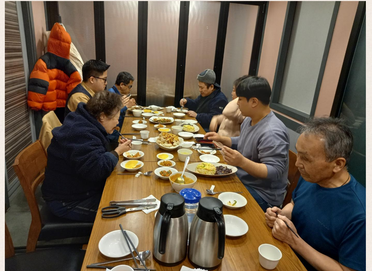
▲ 소통간담회 식사 진행 모습

거주시설연계사업 3차 소통간담회 최종평가회의를 끝으로 모든 활동을 종료한 대린원 종사자&참여자들과 모여 회의를 진행하였습니다.