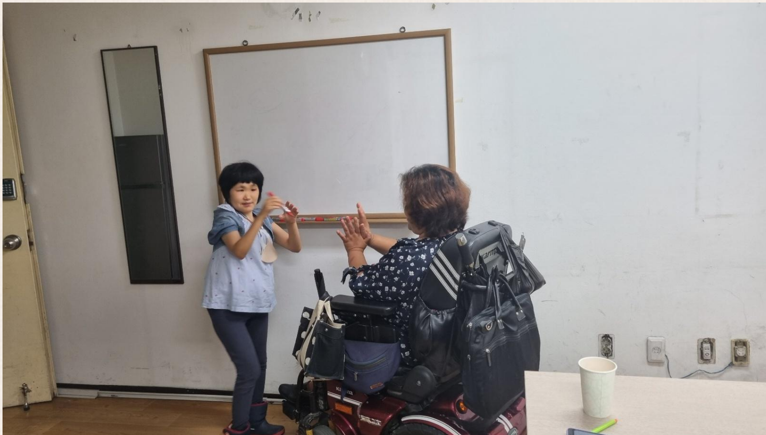
▲ 이○진님 동료상담 진행 모습