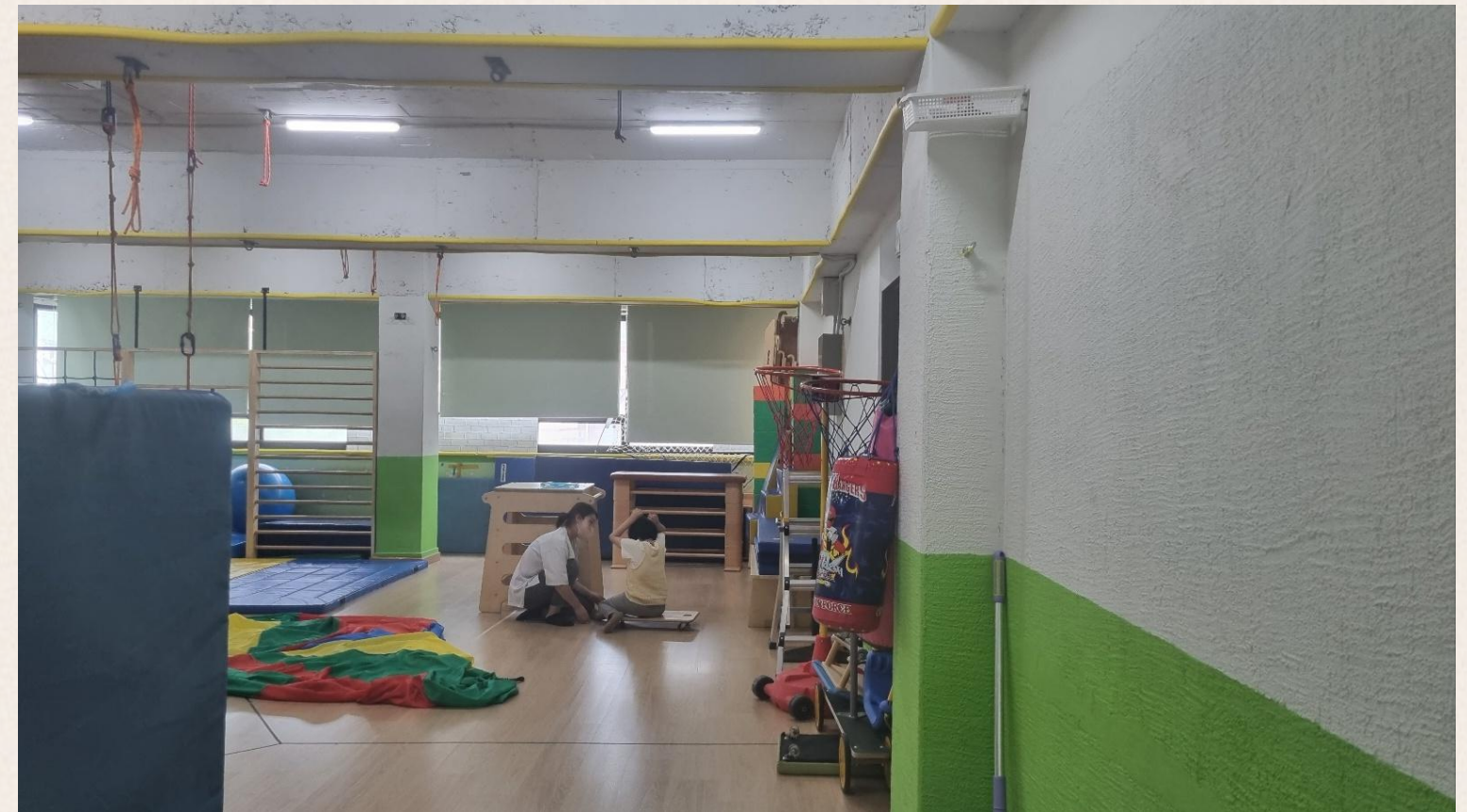
▲ 이○진님 심리운동 진행 모습

2023.05.08(월) 부터 11.22(수) 까지 개별ILP 프로그램을 진행했습니다.