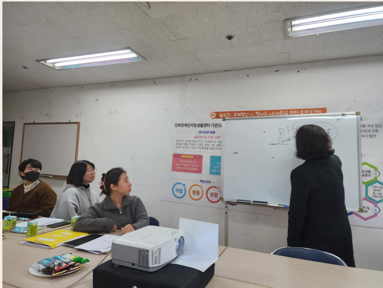
▲ 거주시설연계사업 외부자문회의 진행 모습