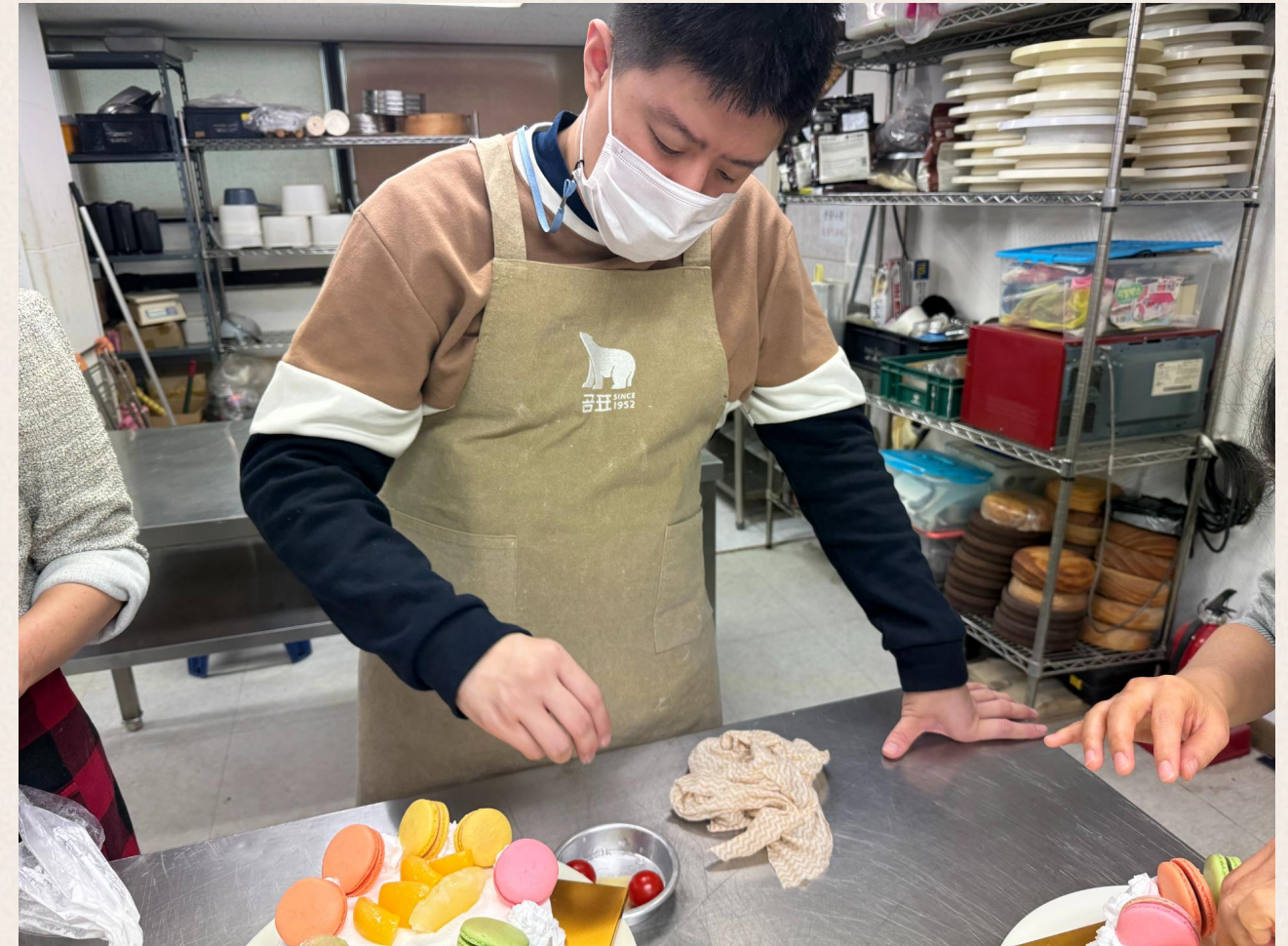
▲ 케이크를 꾸미고 있는 모습

2023년 발달장애인 자조모임‘어울림’은 10차 2023.11.15(수) 제과제빵 체험으로 진행되었습니다.