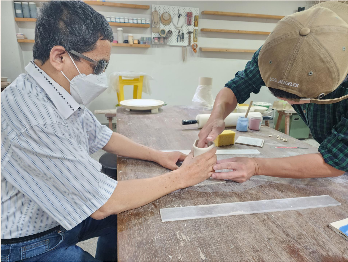
▲ 김○호님 도예 체험