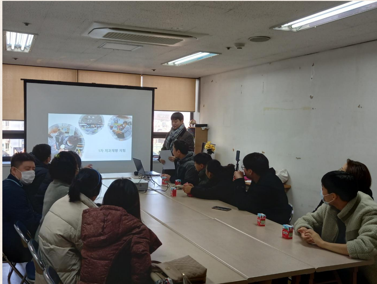
▲ 어떤 프로그램이 가장 기억에 남나요?