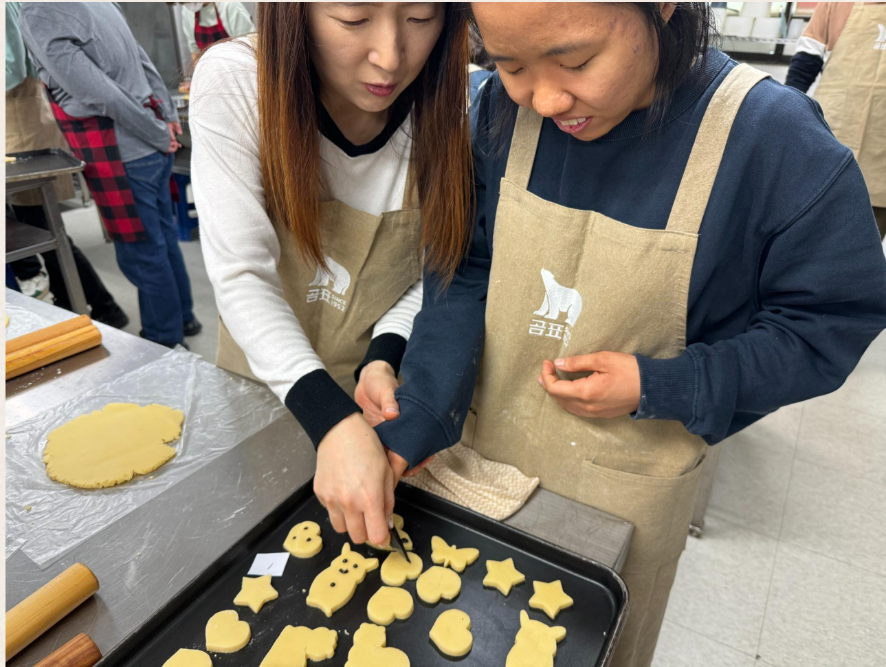
▲ 맛있는 쿠키를 만들고 있습니다!