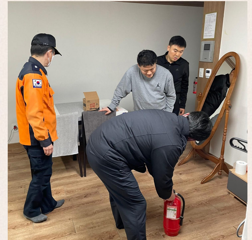
▲ 소화기 이렇게 사용하는겁니다.

분기별 진행되는 소방안전교육이지만 강북소방서 재난관리과 소방관분들의 더욱 전문적이고 심화적인 내용을 통해 입주자들이 화재 발생 시 초기대응, 현장이탈 능력이 더욱 강화되었을 것이라고 생각합니다.