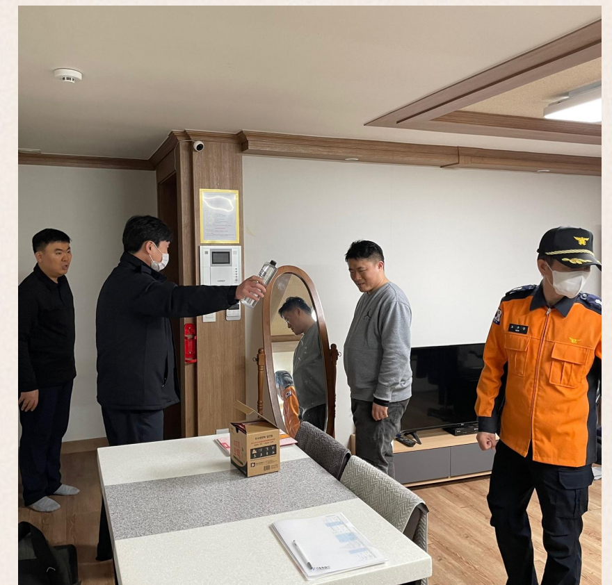
▲ 소방안전교육 진행모습