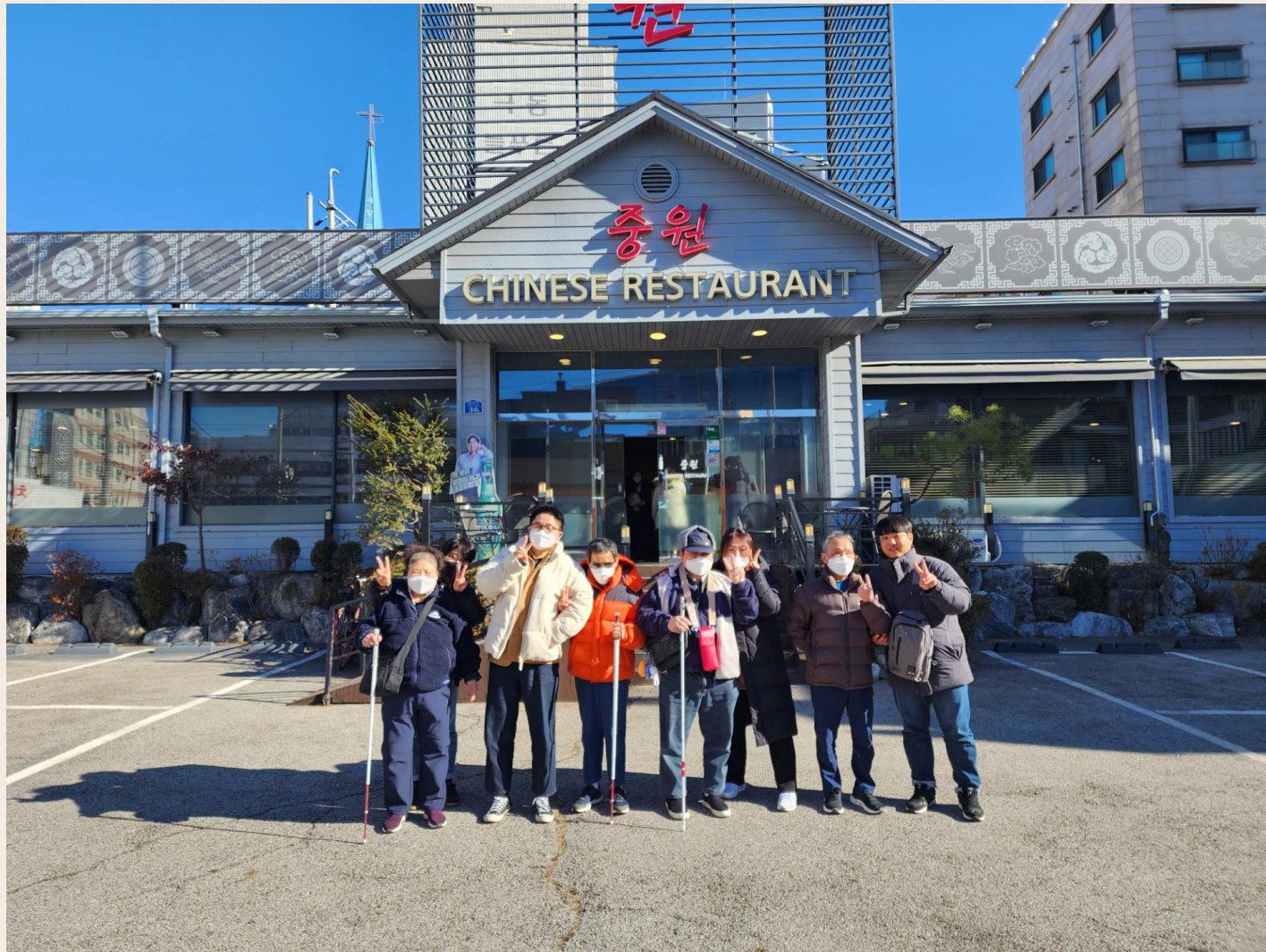
▲ 거주시설연계사업 단체사진