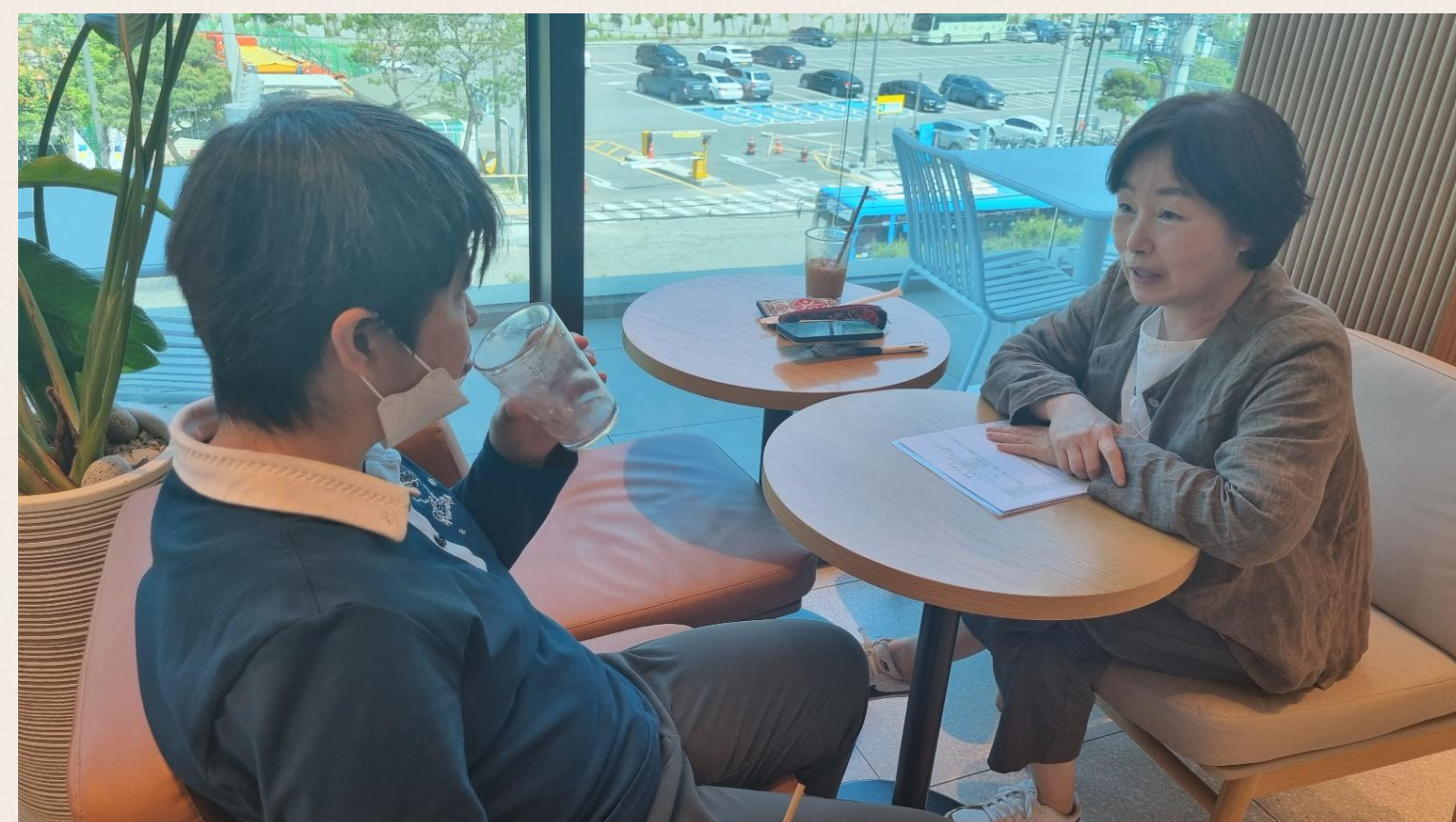
▲ 홍○미님 심리상담 진행 모습