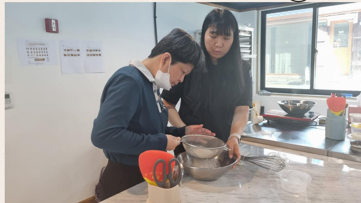
▲ 홍○미님 제과제빵 체험 모습

모든 프로그램에 발전된 모습들을 보여주었는데요 담당자로서 행복한 7개월이었습니다^^ 감사합니다~