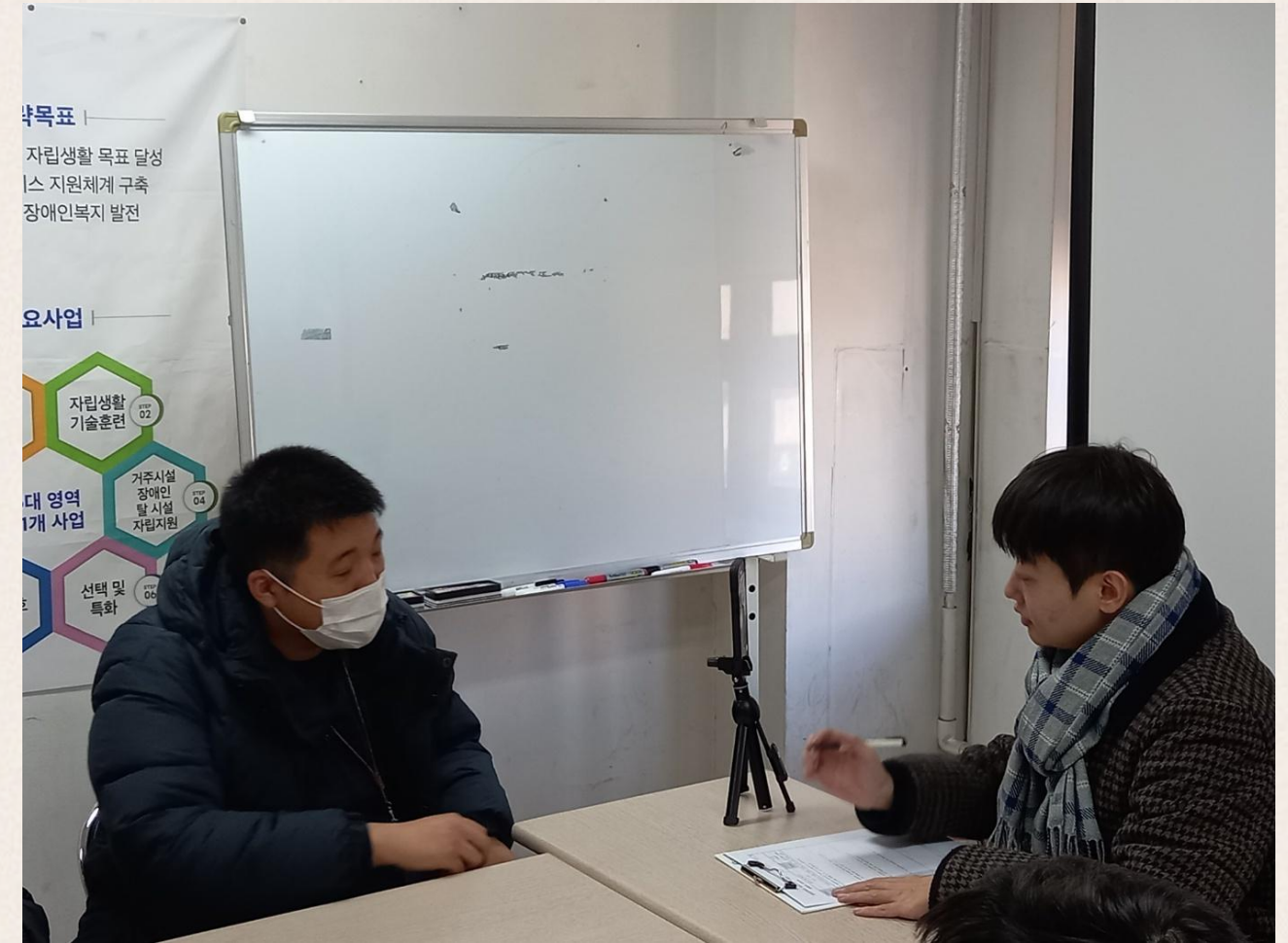
▲ 발달장애인 자조모임에 바라는 점은?

2023년 발달장애인 자조모임‘어울림’ 최종평가가 2023.11.24일(금) 진행되었습니다.