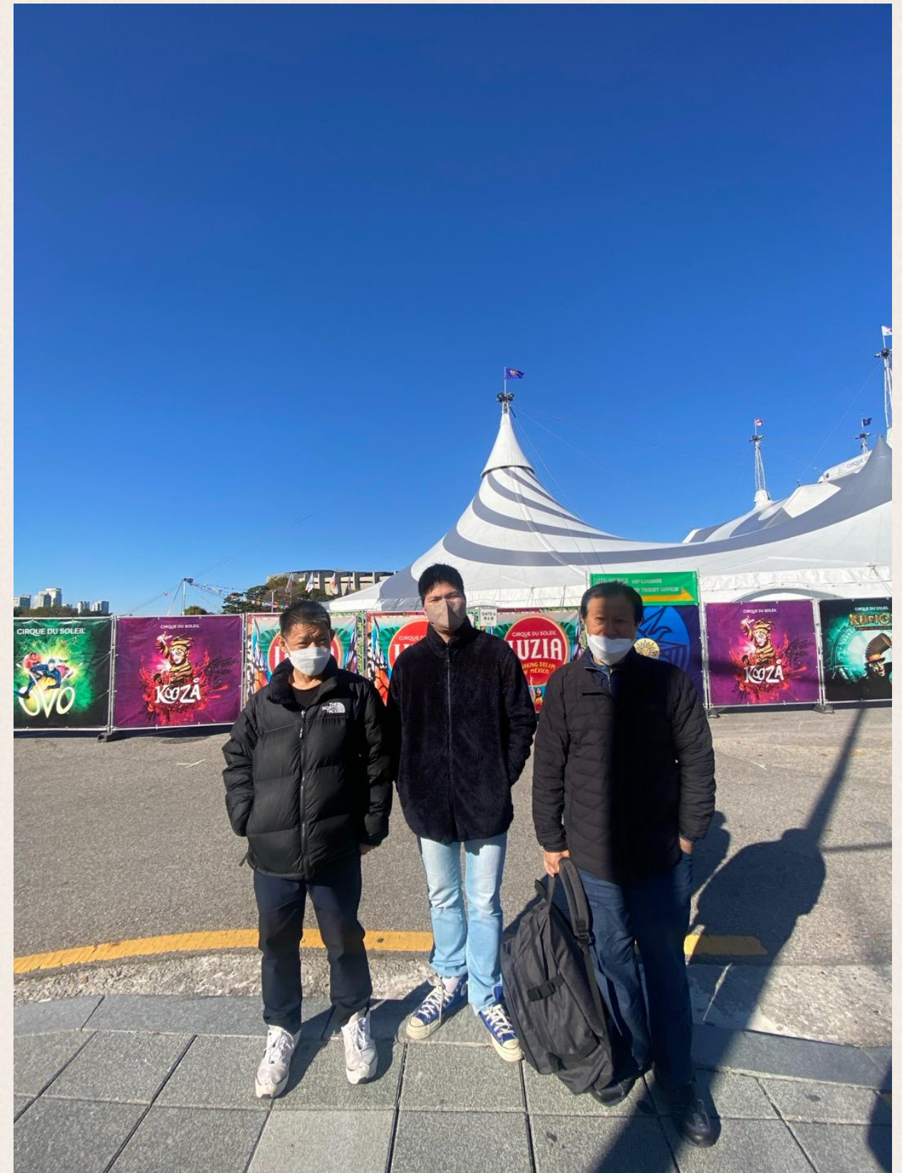
▲ 서커스 공연장 앞에서 다함께 찰칵!

그러나 서커스에 경우에는 중간에 25분이라는 긴 휴게시간이 있고, 조명, 행동, 표정, 의상 등 시각적인 형식에 공연 관람에 특성이 있어 입주자분들이 집중하기 수월할 것으로 판단하였습니다. 또 입주자분들이 지역사회 내 다양한 사람들이 모여 함께하는 것이 상당한 만족도를 표현해 주셨던 것도 이번 서커스 관람을 진행하게 된 주된 요인이었습니다.