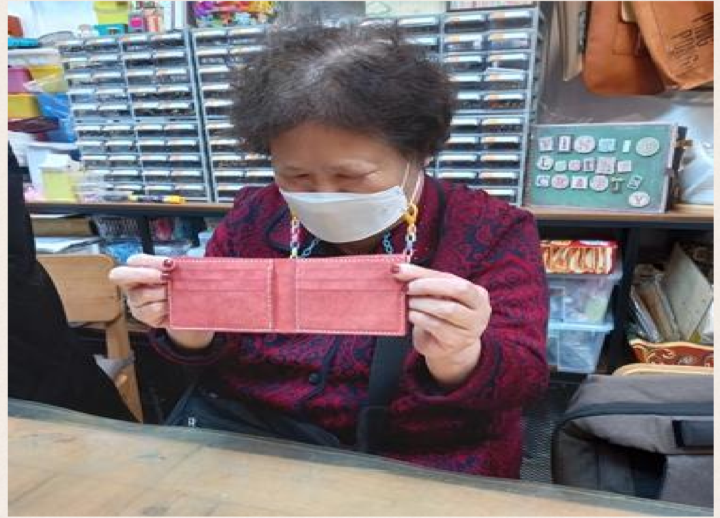
▲ 허○순님 반지갑 만들기