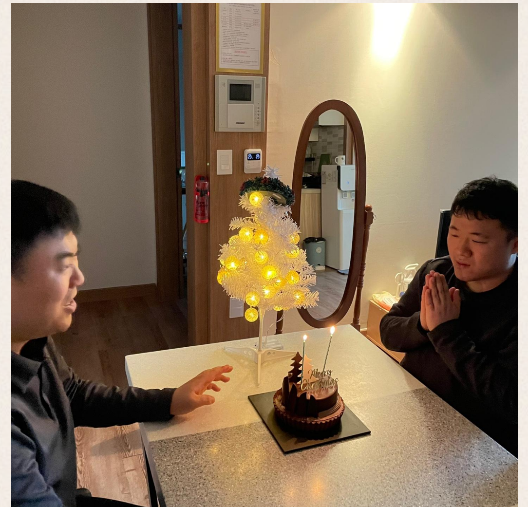
▲ 트리가 너무 예뻐요!~

이 후 케이크 자르기와 함께 저녁식사를 하며 모두가 즐거웠던 크리스마스 파티를 종료하였습니다.