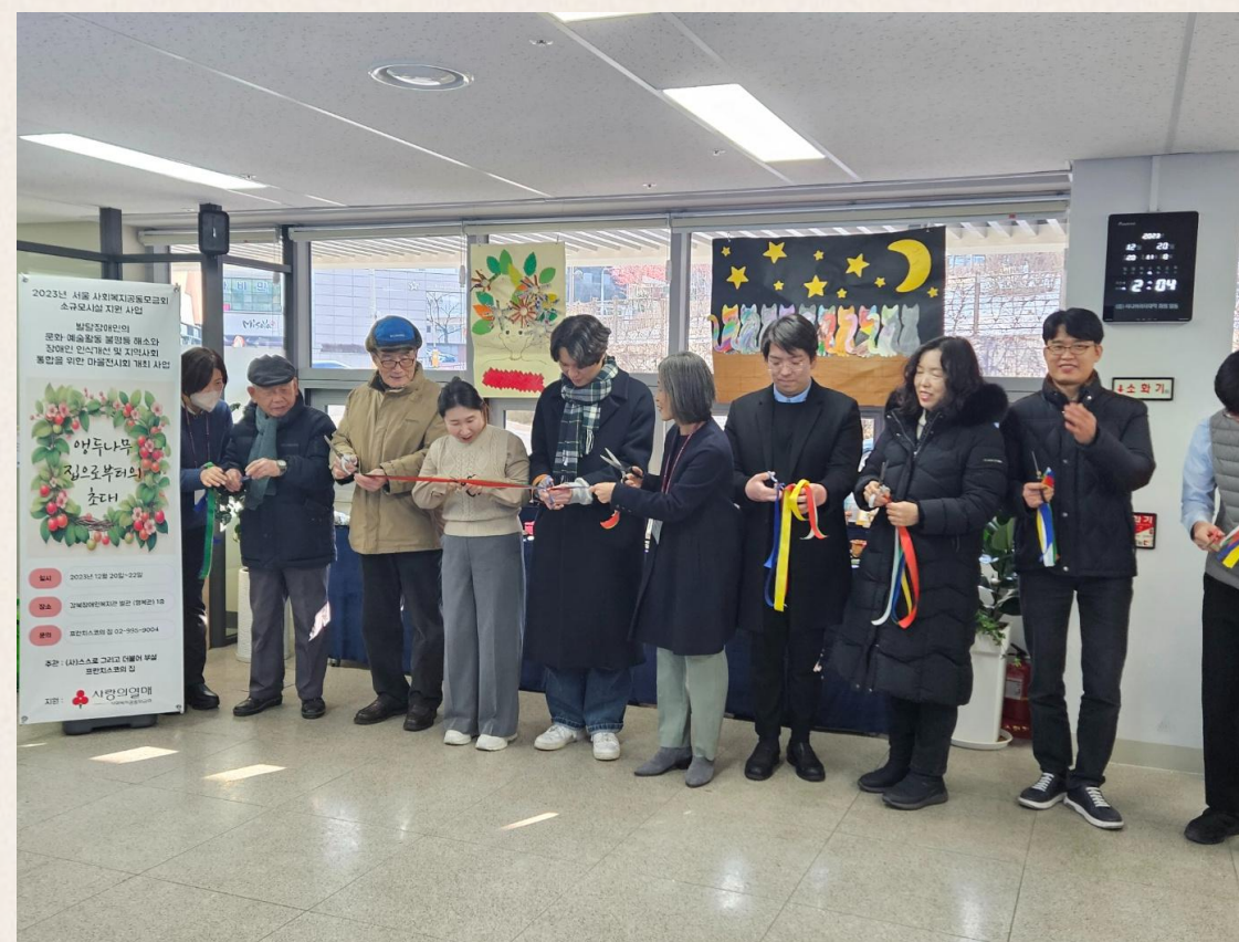
▲ "앵두나무 집으로부터의 초대" 커팅식 진행모습

2023년도 개별자립생활기술 훈련에 참여한 이○진님과 홍○미님의 1년간의 발자취를 보인다하여 한걸음에 달려갔는데요. 아쉽게도 홍○미님의 전시 일정에는 맞추지 못해 아쉬움이 크게 남았습니다.