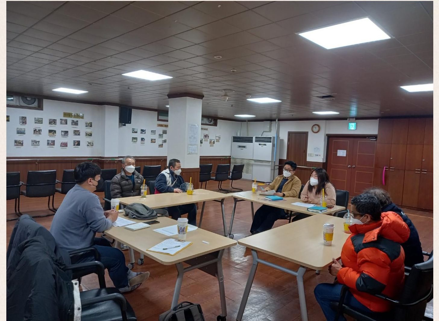
▲ 2024년 거주시설연계사업은 어떻게?

마지막으로 앞으로 2024년 사업에 대한 전반적인 방향에 대해 고민하며 소통하는 것으로 마무리 하였습니다.