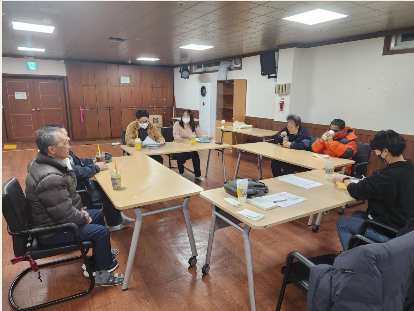
▲ 거주시설연계사업 프로그램 후기 공유

또 참여자분들은 ‘대리원에만 있다 외부로 나가니깐 좋아요.’ ‘내가 스스로 물건(액세서리, 컵 등)을 만들어서 직접 착용도 하고 사용도 할 수 있어서 뿌듯했어요.’ ‘꽃병도 만들고, 네일아트도 하고, 또 한 사람당 40개씩 과자도 직접 만들어서 나눠준게 기억에 남습니다.’ ‘마지막으로 중도 시각장애인이 된 지 1년이 지난 시점에서 외부 활동에 대한 두려움이 있었는데, 이렇게 프로그램을 통해 활동해 보니 도전 의식도 높아져 다양한 활동을 많이 해보고 싶습니다.’라며 다양한 의견을 내셨습니다.