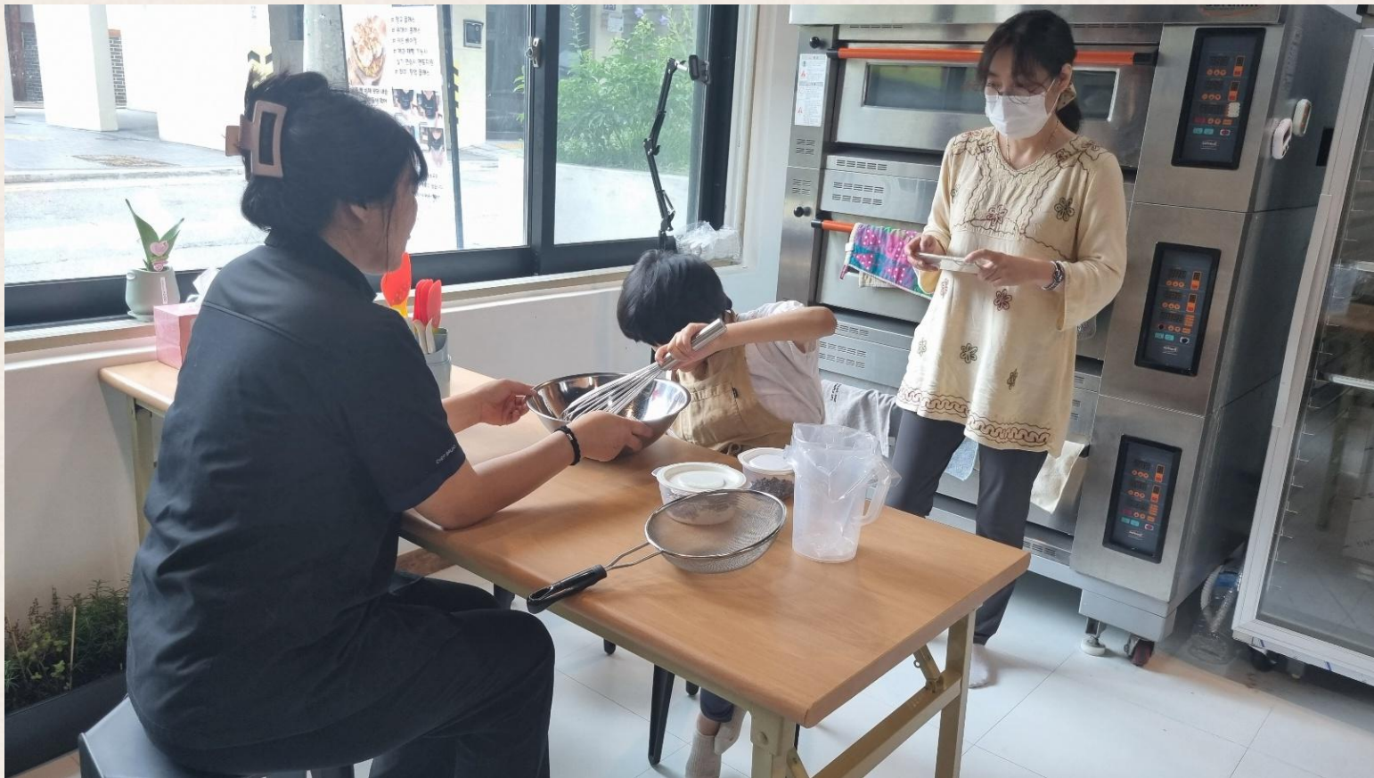
▲ 이○진님 제과제빵 진행 모습